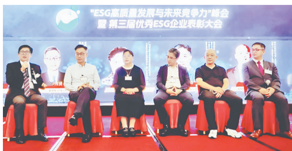
第三届ESG高质量发展与未来竞争力峰会圆桌论坛

2026年,中国ESG制度体系加速完善。1月9日,财政部正式印发《可持续信息鉴证