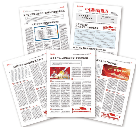
2024年4月9日02版、2024年4月23日03版、2024年4月30日03版、2024年5月7日03版、2024年5月21日03版

一是旗帜鲜明讲政治。坚持把宣传报道好习近平总书记重要活动、重要讲话精神和宣传阐释好习近平新时代中国特色社会主义思想作为首要政治任务和最最重要的政治责任与工作遵循。充分用好重点专题新闻策划协调机制,发挥全媒体传播矩阵优势,形成强大报道合力。例如,在报纸开设“深入学习贯彻习近平总书记关于新质生产力的重要论述”等专题专栏,累计刊发26个版,确保习近平新时代中国特色社会主义思想始终成为引领媒体传播的最强音。