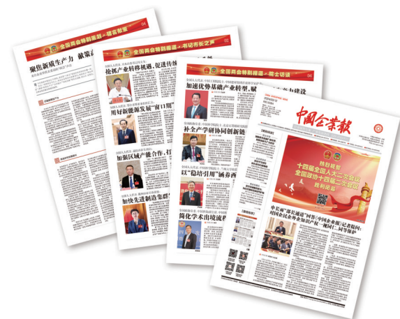
2024年3月5日04版、2024年3月5日02版、2024年3月12日04版、2024年3月12日01版

会的各地市市长、专家院士和企业家代表委员进行深度访谈,为实现高质量发展鼓干劲、传经验、启智慧、聚心力。全国两会报道的规模、方式及报道质量等,都达到了应有的高度。