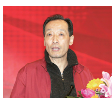
全国政协委员、中华全国新闻工 作者协会原党组书记惠生