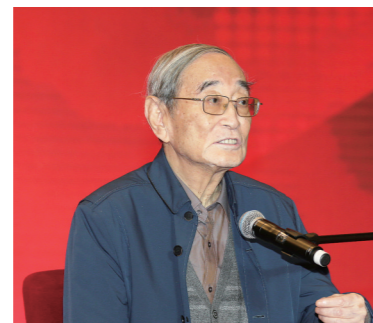
十届、十一届、十二届全国政协常委,经济委员会副主任,著名经济学家厉以宁