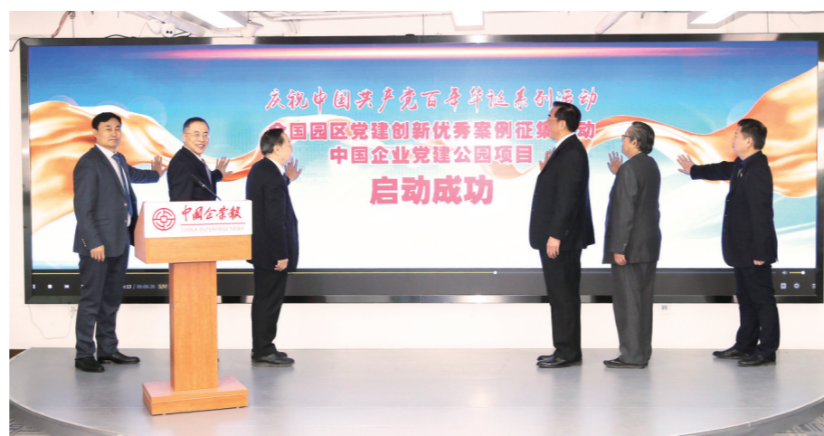
2021年1月17日,北京,在第十八届中国企业发展论坛上,举办了全国园区党建创新优秀案例征集活动和中国共产党党建公园项目启动仪式。

为了落实25号和4号文件精神,从2018年5月开始,《中国企业报》集团持续三年时间,分赴全国100个地市、近1000个区县和园区,深入一线采访调研和产业服务,并于2018年开始举办全国企业营商环境研讨会,每年两次发布“中国企业营商环境(案例)城市、园区”报告及系列评价结果。目前,年度“中国企业营商环境(案例)城市、园区”已连续发布4年共8个批次,成为中国企业发展论坛、“一带一路”园区建设国际合作峰会的重要成果与组成部分。