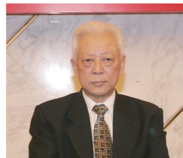
十一届全国人大常委会副 委员长周铁农