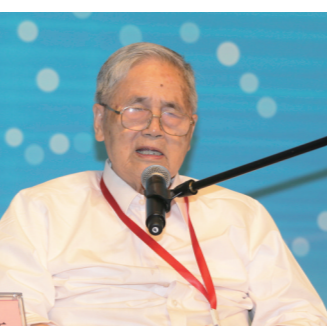
中国工程院院士、著名经济 学家李景文