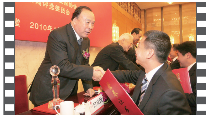
2010年1月,2009年度中国企业十大新闻发布活动在人民大会堂举办,第九届、第十届、第十一届全国政协副主席白立忱为获奖单位颁奖。

《中国企业报》、中国企业网、中国企业APP、《中国企业报》微信、微博,战新产业微信、特色小镇微信,构建起集内容传播、品牌推广于一体的全媒体服务矩阵。