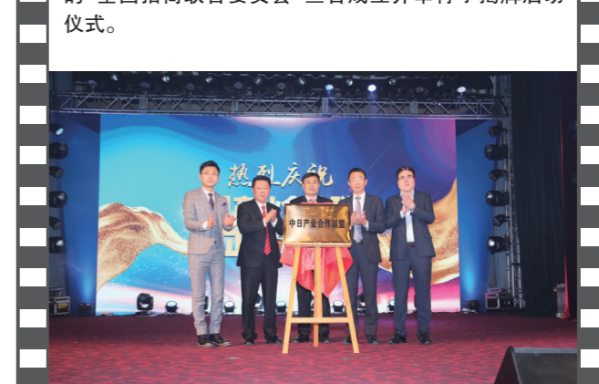
2019年12月21日,北京饭店,在第十七届中国企业发展论坛上,中日产业合作联盟正式揭牌。