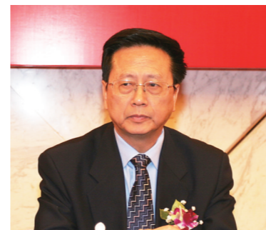
十一届、十二届全国人大常 委会副委员长陈昌智