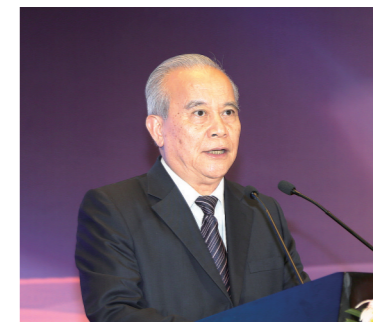
十二届全国政协副主席王钦敏