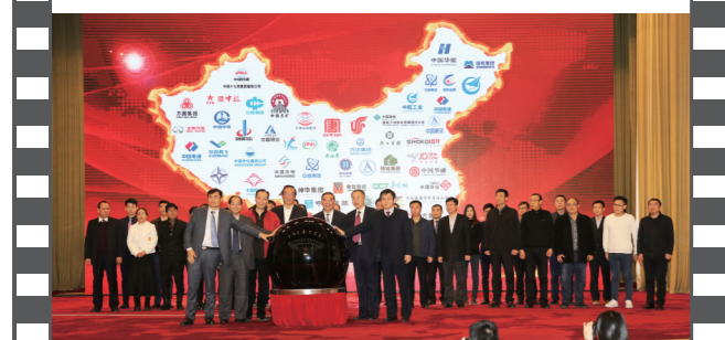
2018年1月20日,北京人民大会堂,在第十五届中国企业发展论坛上,30家企业代表共同启动“十九大精神进企业系列活动”。