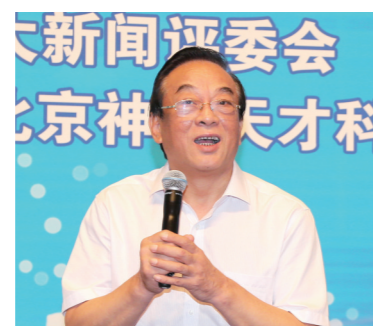
十二届全国政协经济委员会专 副主任,甘肃省原常委、副省长石军

由中国企业联合会、中国企业家协会指导,《中国企业报》集团、中国企业十大新闻评选委员会、中国企业发展论坛组织委员会主办的中国企业发展论坛,已经连续成功举办了十九届,在我国企业、政府、学术界形成了广泛影响。长期以来,论坛活动得到了国家领导人以及国务院相关部委领导的关注和支持,王光英、许嘉璐、蒋正华、顾秀莲、周铁农、陈昌智、万国权、陈锦华、王忠禹、郝建秀、白立忱、王钦敏等国家领导人都曾出席发布暨论坛活动。中国500强企业和一大批卓有影响的企业家,都曾参与活动。