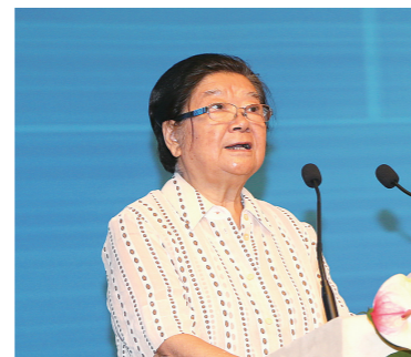
十届全国人大常委会 副委员长顾秀莲