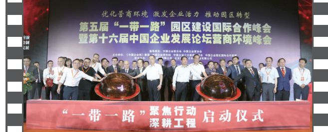
2019年6月29日,北京国家会议中心,在第十六届中国企业发展论坛上,《中国企业报》集团联合相关企业、机构发起了“一带一路”行动工程——合作公司启动仪式和重点项目启动仪式。