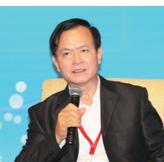
十二届全国政协常委、国 务院参事李玉光