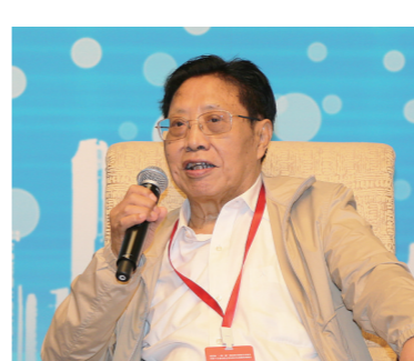
外交部原副部长、外交部政策 咨询委员吉定定