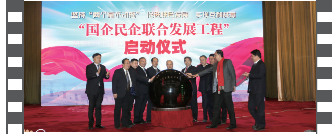
2018年12月28日,北京人民大会堂,在第十六届中国企业发展论坛上,举办了“国企民企联合发展工程”启动仪式。