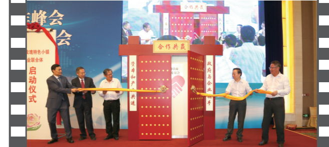
2017年6月25日,北京钓鱼台国宾馆,在第十四届中国企业发展论坛上,由《中国企业报》集团等联合发起的“全国招商联合委员会”宣告成立并举行了揭牌启动仪式。