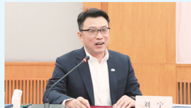
中国工业设计协会会长刘宁在会上发言