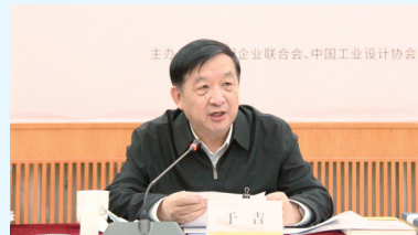
中国企联常务副理事长于吉主持座谈会