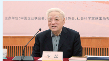
中国企联原副会长、中国工业设计协会原会长朱焘介绍新书创作经历