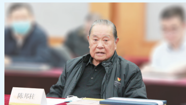
原国家经贸委副主任陈邦柱在会上发言