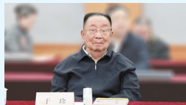
原国家经贸委副主任于珍在会上发言