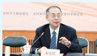
中国企联常务副会长兼理事长朱宏任出席座谈会并发表讲话