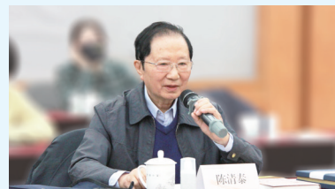
原国家经贸委副主任陈清泰在会上发言