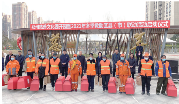
2021年郑州冬季救助区县(市)联动活动启动仪式现场为环卫工送慰问品

2021年12月16日上午,郑州慈善文化园开园仪式暨2021年冬季救助区县(市)联动活动在管城区魏庄游园举行,标志着郑州市首个“慈善广场”建成投用,增添一处靓丽的慈善新地标。