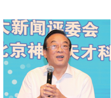
十二届全国政协经济委员会专职副主任,甘肃省原常委、副省长石军

由中国企业联合会、中国企业家协会指导,《中国企业报》集团、中国企业十大新闻评选委员会、中国企业发展论坛组织委员会主办的中国企业发展论坛,已经连续成功举办了十八届,在我国企业、政府、学术界形成了广泛影响。长期以来,论坛活动得到了国家领导人以及国务院相关部委领导的关注和支持,王光英、许嘉璐、蒋正华、顾秀莲、周铁农、陈昌智、万国权、陈锦华、王忠禹、郝建秀、白立忱、王钦敏等国家领导人都曾出席发布暨论坛活动。中国500强企业和一大批有影响的企业家,都曾参与活动。