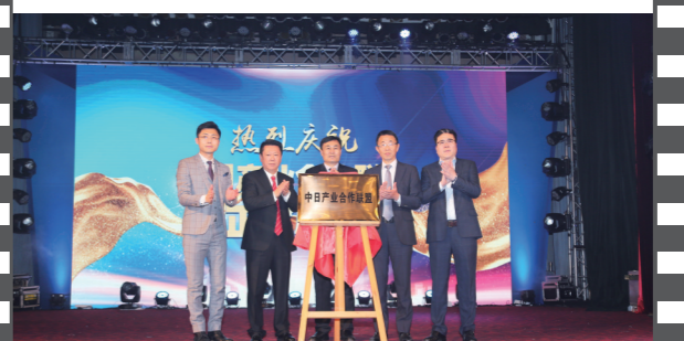
2019年12月21日,北京饭店,在第十七届中国企业发展论坛上,中日产业合作联盟正式揭牌。