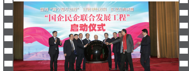
2018年12月28日,北京人民大会堂,在第十六届中国企业发展论坛上,举办了国企民企联合发展工程启动仪式。