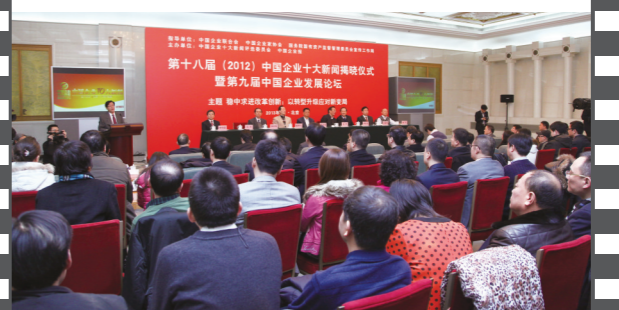
2013年1月,第九届中国企业发展论坛在北京人民大会堂举办。