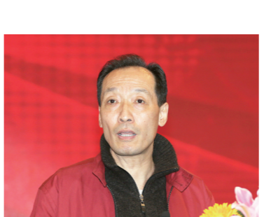
全国政协委员、中华全国新闻工作者协会原党组书记惠生