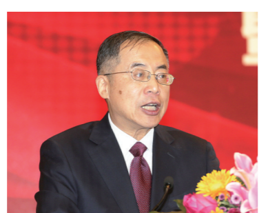
中国企业联合会、中国企业家协会常务副会长兼理事长朱宏任