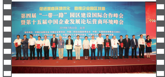
2018年7月22日,北京钓鱼台国宾馆,在第十五届中国企业发展论坛上,参会嘉宾与十佳案例获评单位代表合影。