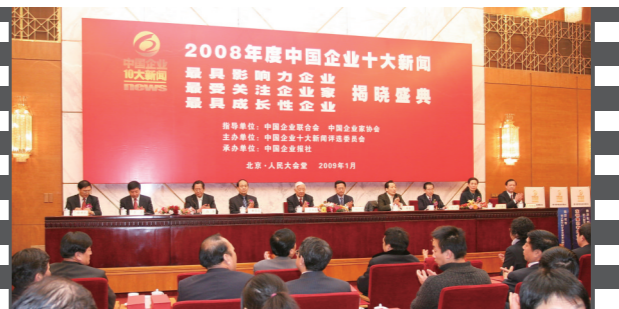
2009年1月,2008年度中国企业十大新闻发布活动在北京人民大会堂隆重举办。

《中国企业报》、中国企业网、中国企业APP、《中国企业报》微信、微博,战新产业微信、特色小镇微信,构建起集内容传播、品牌推广于一体的全媒体服务体系。