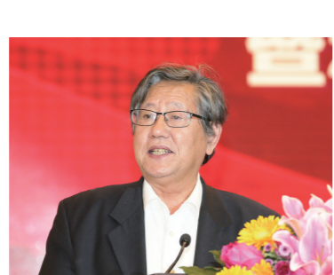
中国企业联合会、中国企业家协会原执行副会长,《经济日报》原总编辑冯并