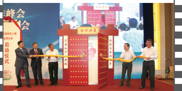
2017年6月25日,北京钓鱼台国宾馆,在第十四届中国企业发展论坛上,由《中国企业报》集团等联合发起的“全国招商联合委员会”宣告成立并举行了揭牌启动仪式。