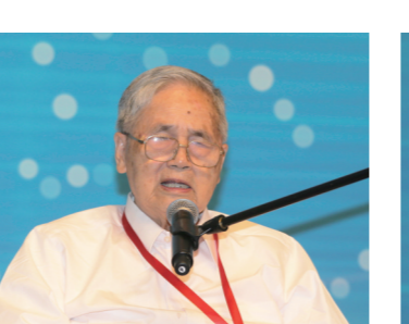
中国工程院院士、著名经济学家李京文