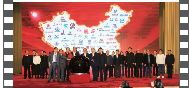
2018年1月20日,北京人民大会堂,在第十五届中国企业发展论坛上,30家企业代表共同启动“十九大精神进企业系列活动”。