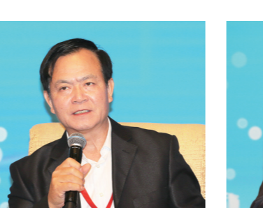
十二届全国政协常委、国务院参事李玉光