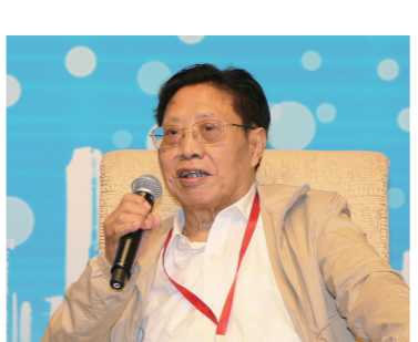
外交部原副部长,外交部政策咨询委员吉国定