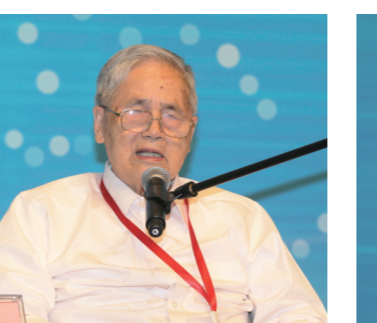
中国工程院院士、著名经济学家李京文