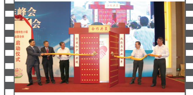
2017年6月25日,北京钓鱼台国宾馆,在第十四届中国企业发展论坛上,由《中国企业报》集团等联合发起的“全国招商联合委员会”宣告成立并举行了揭牌启动仪式。