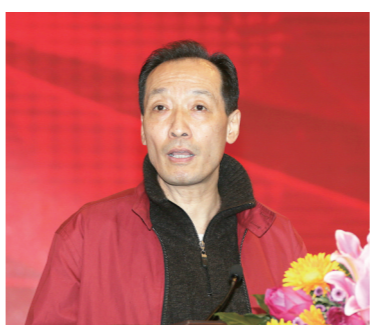
全国政协委员、中华全国新闻工作者协会原党组书记惠生