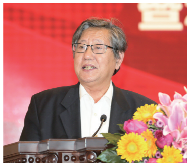
中国企业联合会、中国企业家协会原执行副会长,《经济日报》原总编辑冯并