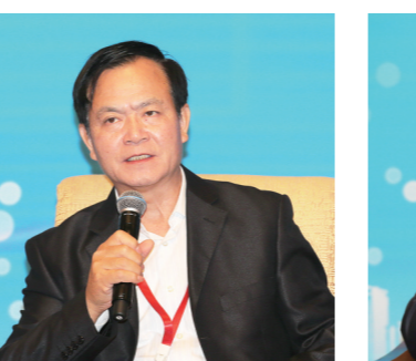
十二届全国政协常委、国务院参事李玉光