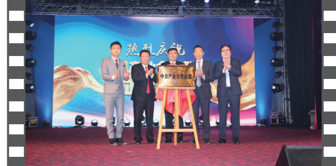
2019年12月21日,北京饭店,在第十七届中国企业发展论坛上,中日产业合作联盟正式揭牌。