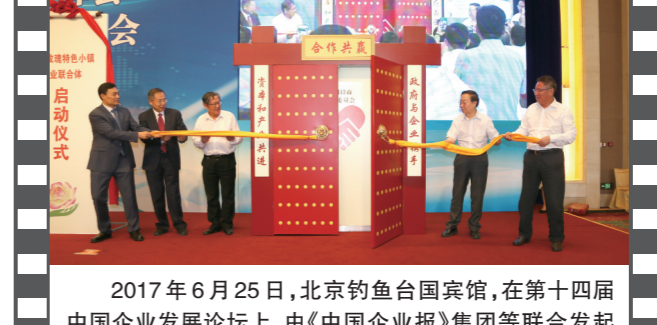
2017年6月25日,北京钓鱼台国宾馆,在第十四届中国企业发展论坛上,由《中国企业报》集团等联合发起的“全国招商联合委员会”宣告成立并举行了揭牌启动仪式。