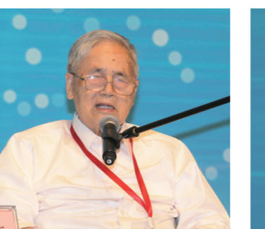
中国工程院院士、著名经济学家李京文