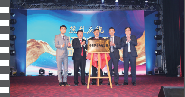
2019年12月21日,北京饭店,在第十七届中国企业发展论坛上,中日产业合作联盟正式揭牌。