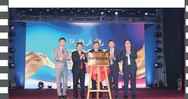
2019年12月21日,北京饭店,在第十七届中国企业发展论坛上,中日产业合作联盟正式揭牌。