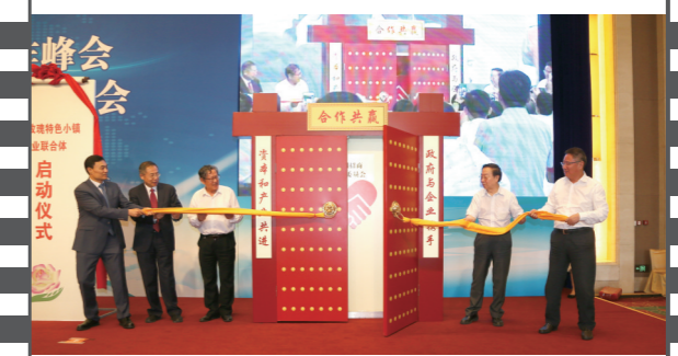
2017年6月25日,北京钓鱼台国宾馆,在第十四届中国企业发展论坛上,由《中国企业报》集团等联合发起的“全国招商联合委员会”宣告成立并举行了揭牌启动仪式。