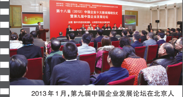
2013年1月,第九届中国企业发展论坛在北京人民大会堂举办。