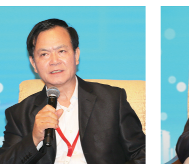
十二届全国政协常委、国务院参事李玉光