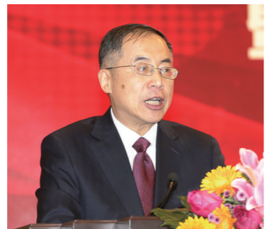
中国企业联合会、中国企业家协会常务副会长兼理事长朱宏任