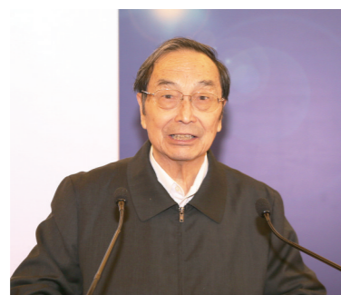
九届、十届全国人大常委会副委员长蒋正华