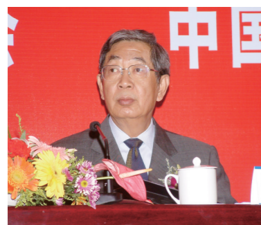
九届、十届全国人大常委会副委员长许嘉璐