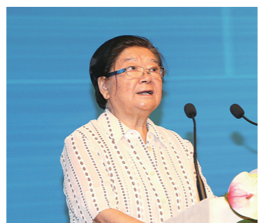
十届全国人大常委会副委员长顾秀莲