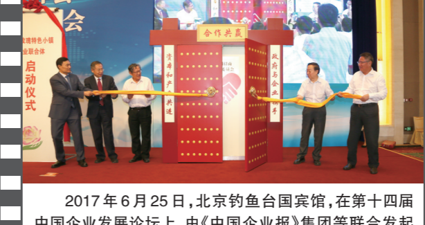
2017年6月25日,北京钓鱼台国宾馆,在第十四届中国企业发展论坛上,由《中国企业报》集团等联合发起的“全国招商联合委员会”宣告成立并举行了揭牌启动仪式。