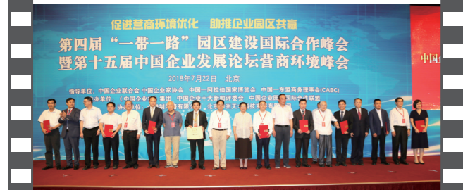
2018年7月22日,北京钓鱼台国宾馆,在第十五届中国企业发展论坛上,参会嘉宾与十佳案例获评单位代表合影。