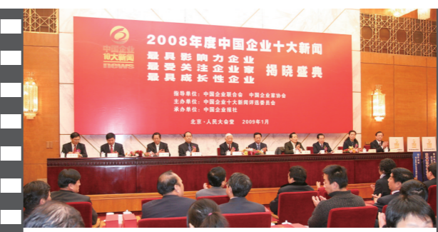
2009年1月,2008年度中国企业十大新闻发布活动在人民大会堂隆重举办。