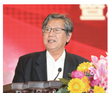
中国企业联合会、中国企业家协会原执行副会长,《经济日报》原总编辑冯并