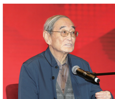
十届、十一届、十二届全国政协常委,经济委员会副主任,著名经济学家厉以宁