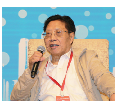
外交部原副部长、外交部政策咨询委员吉定定