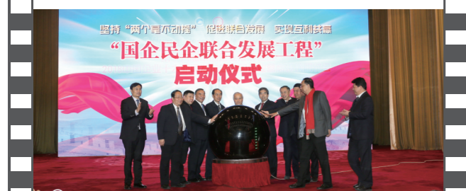
2018年12月28日,北京人民大会堂,在第十六届中国企业发展论坛上,举办了国企民企联合发展工程启动仪式。