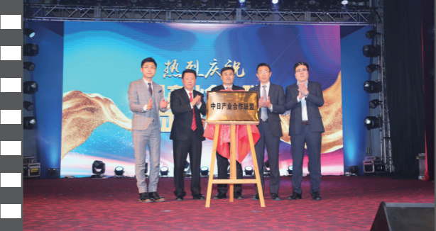
2019年12月21日,北京饭店,在第十七届中国企业发展论坛上,中日产业合作联盟正式揭牌。