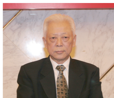
十一届全国人大常委会副委员长周铁农