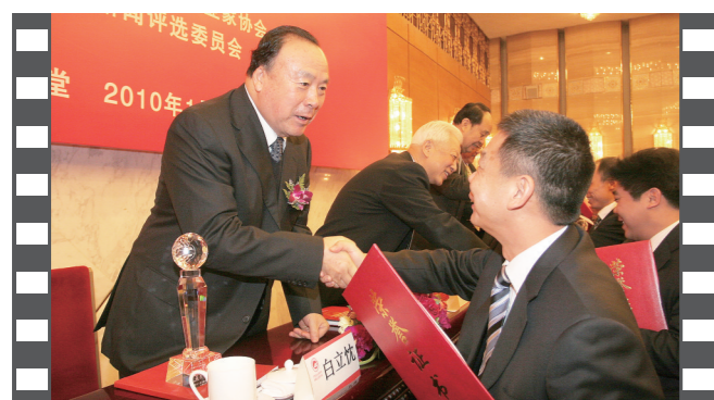
2010年1月,2009年度中国企业十大新闻发布活动在人民大会堂举办,第九届、第十届、第十一届全国政协副主席白立忱为获奖单位颁奖。

《中国企业报》、中国企业网、中国企业APP、《中国企业报》微信、微博,战新产业微信、特色小镇微信,构建起集内容传播、品牌推广于一体的全媒体服务体系。