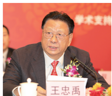
十届全国政协副主席王忠禹