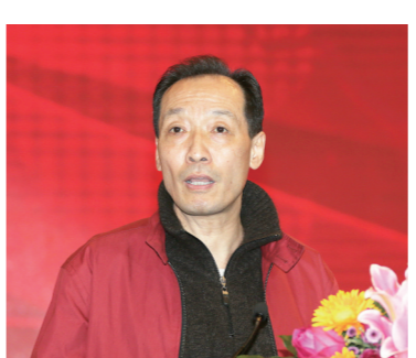
全国政协委员、中华全国新闻工作者协会原党组书记惠生