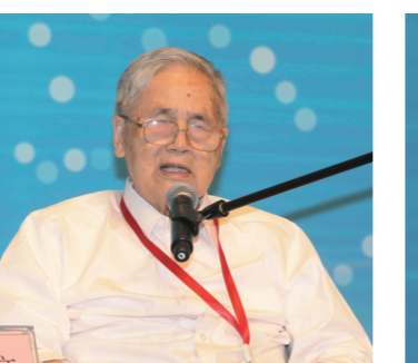
中国工程院院士、著名经济学家李京文