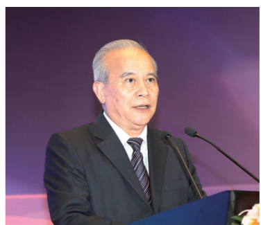
十二届全国政协副主席王钦敏