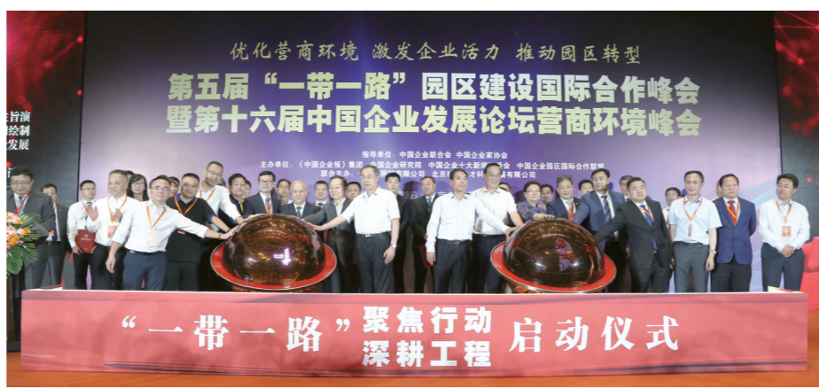
2019年6月29日,北京国家会议中心,在第十六届中国企业发展论坛上,《中国企业报》集团联合相关企业、机构发起了“一带一路”行动工程——合作公司启动仪式和重点项目启动仪式。

为了落实中共中央、国务院《关于营造企业家健康成长环境弘扬优秀企业家精神更好发挥企业家作用的意见》(中发[2017]25号)和国务院办公厅下发的《关于聚焦企业关切进一步推动优化营商环境政策落实的通知》,从2018年5月开始,《中国企业报》集团持续两年时间,分赴全国100个地市、近1000个县区和园区,深入一线采访调研和提供服务,并于2018年发布了第二批“中国企业营商环境(案例)十佳城市”榜单。2019年,《中国企业报》集团再次组织调研小组分头深入地方一线,进行营商环境实地调研,最终形成“2019中国企业营商环境(案例)十佳城市(第三批)”等多个榜单,并于6月29日在北京国家会议中心举办的第十六届中国企业发展论坛营商环境峰会暨第五届“一带一路”园区建设国际合作峰会上对外发布。