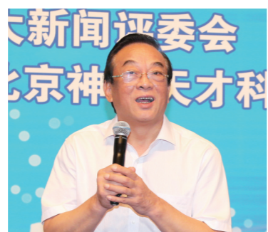
十二届全国政协经济委员会专职副主任,甘肃省原常委、副省长石军

由中国企业联合会、中国企业家协会指导,《中国企业报》集团、中国企业十大新闻评选委员会、中国企业发展论坛组委会主办的中国企业发展论坛,已经连续成功举办了十八届,在我国企业、政府、学术界形成了广泛影响。长期以来,论坛活动得到了国家领导人以及国务院相关部门领导的关注和支持,王光英、许嘉璐、蒋正华、顾秀莲、周铁农、陈昌智、万国权、陈锦华、王忠禹、郝建秀、白立忱、王钦敏等国家领导人都曾出席发布暨论坛活动。中国500强企业和一大批卓有成就的企业家,都曾参与活动。