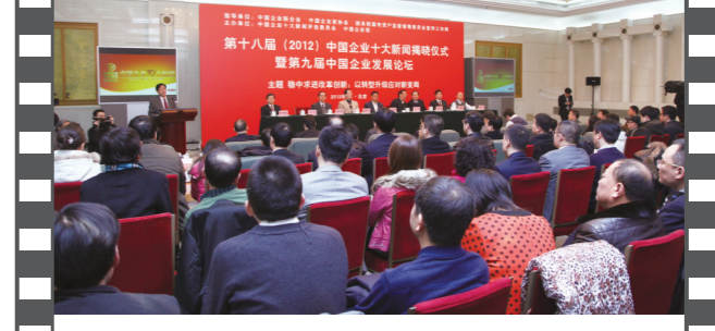
2013年1月,第九届中国企业发展论坛在北京人民大会堂举办。