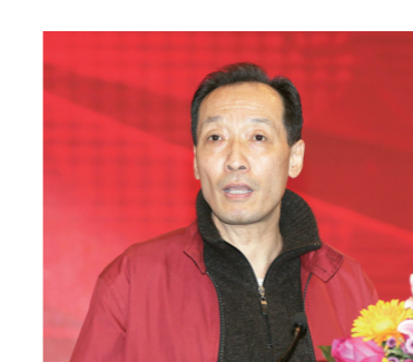
全国政协委员、中华全国新闻工作者协会原党组书记惠生