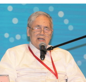
中国工程院院士、著名经济学家李京文