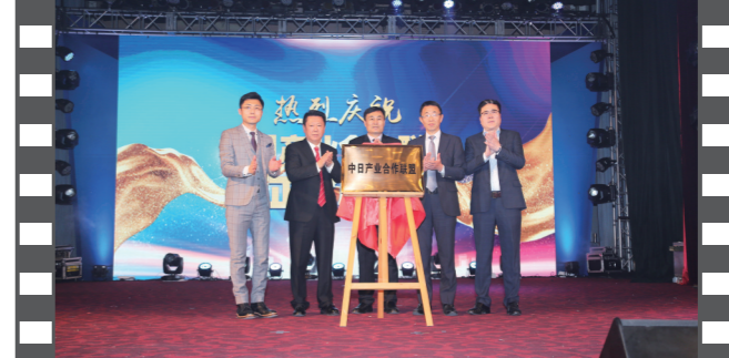
2019年12月21日,北京饭店,在第十七届中国企业发展论坛上,中日产业合作联盟正式揭牌。