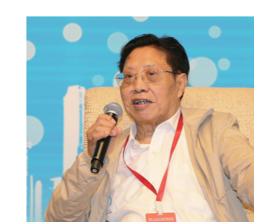
外交部原副部长、外交部政策咨询委员吉定定