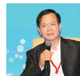
十二届全国政协常委、国务院参事李玉光