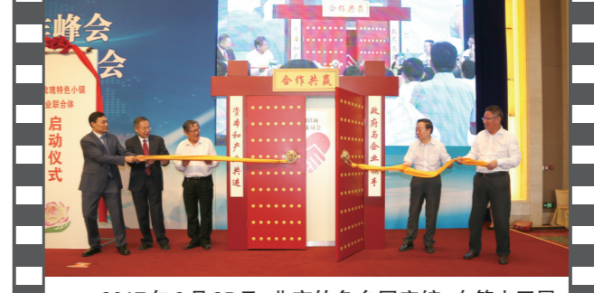
2017年6月25日,北京钓鱼台国宾馆,在第十四届中国企业发展论坛上,由《中国企业报》集团等联合发起的“全国招商联合委员会”宣告成立并举行了揭牌启动仪式。