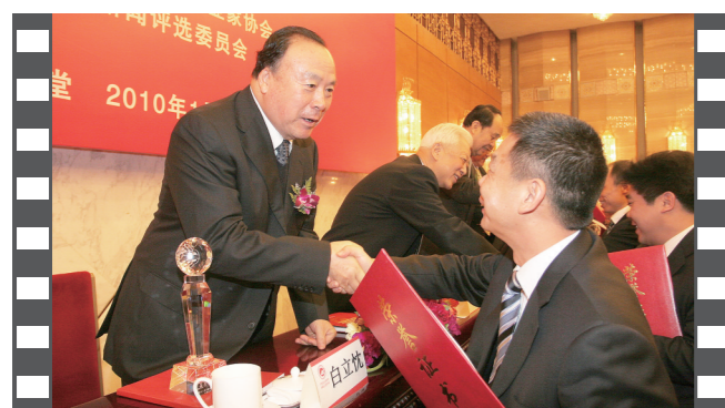
2010年1月,2009年度中国企业十大新闻发布活动在人民大会堂举办,第九届、第十届、第十一届全国政协副主席白立忱为获奖单位颁奖。

《中国企业报》,中国企业网,中国企业APP,《中国企业报》微信、微博,战新产业微信,特色小镇微信,构建起集内容传播、品牌推广于一体的全媒体服务体系。