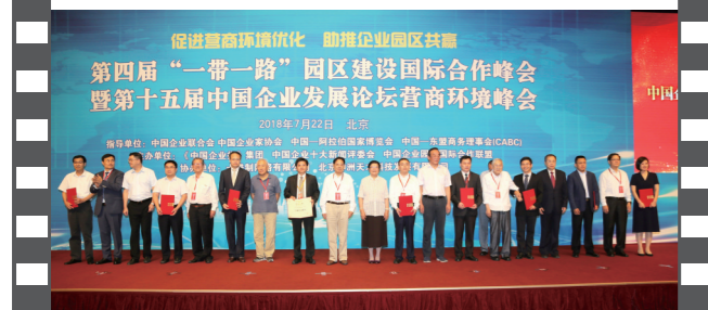
2018年7月22日,北京钓鱼台国宾馆,在第十五届中国企业发展论坛上,参会嘉宾与十佳案例获评单位代表合影。