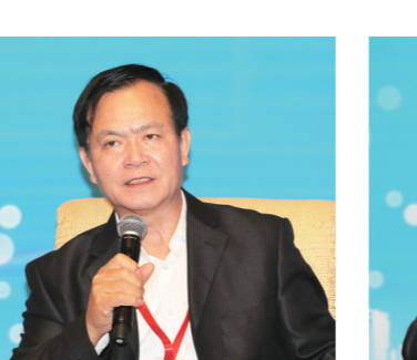
十二届全国政协常委、国务院参事李玉光