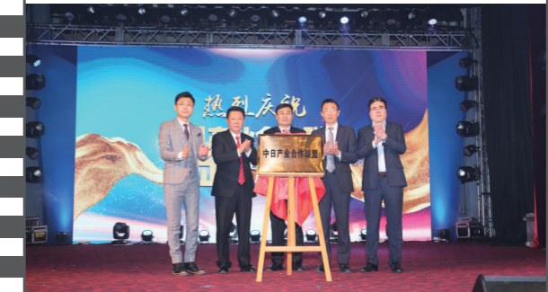
2019年12月21日,北京饭店,在第十七届中国企业发展论坛上,中日产业合作联盟正式揭牌。