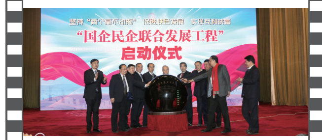
2018年12月28日,北京人民大会堂,在第十六届中国企业发展论坛上,举办了国企民企联合发展工程启动仪式。