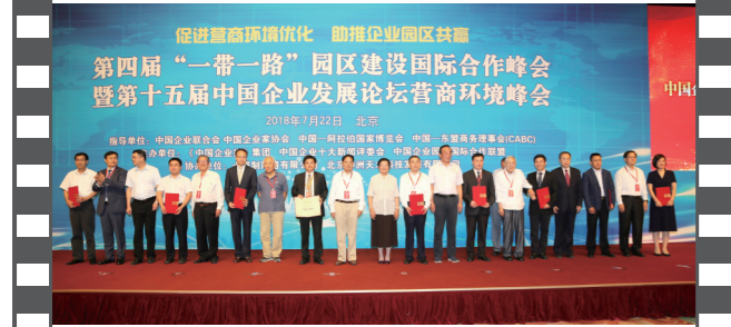
2018年7月22日,北京钓鱼台国宾馆,在第十五届中国企业发展论坛上,参会嘉宾与十佳案例获评单位代表合影。