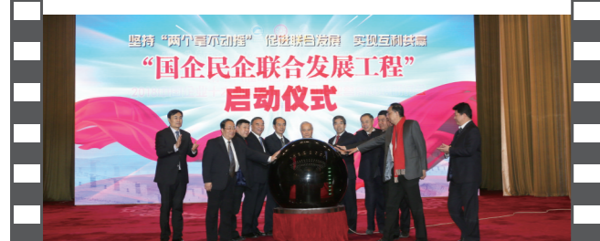
2018年12月28日,北京人民大会堂,在第十六届中国企业发展论坛上,举办了国企民企联合发展工程启动仪式。