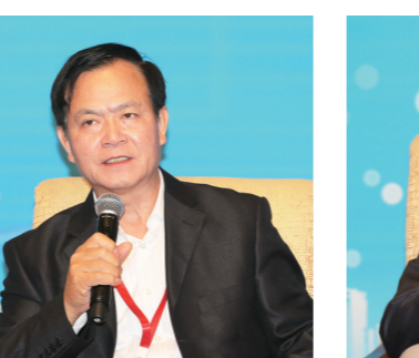
十二届全国政协常委、国务院参事李玉光