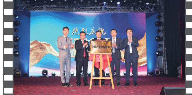
2019年12月21日,北京饭店,在第十七届中国企业发展论坛上,中日产业合作联盟正式揭牌。