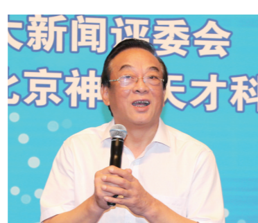
十二届全国政协经济委员会专职副主任,甘肃省原常委、副省长石军

由中国企业联合会、中国企业家协会指导,《中国企业报》集团、中国企业十大新闻评选委员会、中国企业发展论坛组委会主办的中国企业发展论坛,已经连续成功举办了十六届,在我国企业、政府、学术界形成了广泛影响。长期以来,论坛活动得到了国家领导人以及国务院相关部门领导的关注和支持,王光英、许嘉璐、蒋正华、顾秀莲、周铁农、陈昌智、万国权、陈锦华、王忠禹、郝建秀、白立忱、王钦敏等国家领导人都曾出席发布暨论坛活动。中国500强企业和一大批有影响的企业家,都曾参与活动。