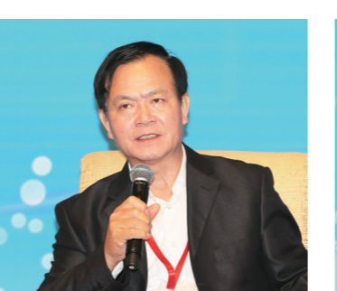
十二届全国政协常委、国务院参事李玉光