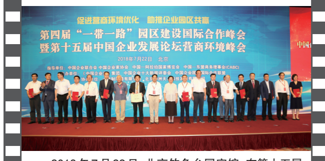
2018年7月22日,北京钓鱼台国宾馆,在第十五届中国企业发展论坛上,参会嘉宾与十佳案例获评单位代表合影。