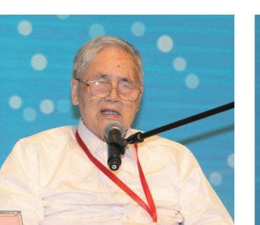
中国工程院院士、著名经济学家李京文