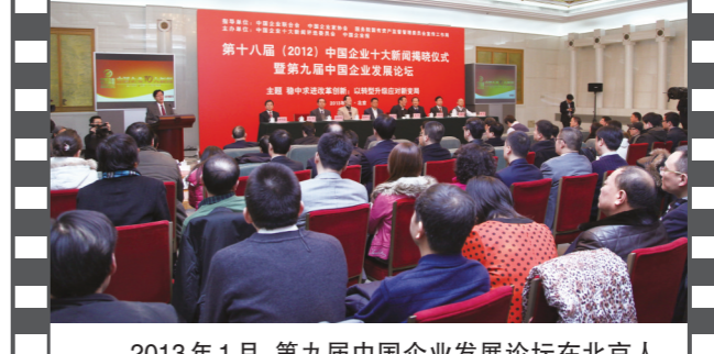
2013年1月,第九届中国企业发展论坛在北京人民大会堂举办。