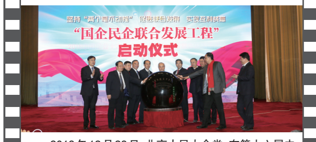
2018年12月28日,北京人民大会堂,在第十六届中国企业发展论坛上,举办了国企民企联合发展工程启动仪式。