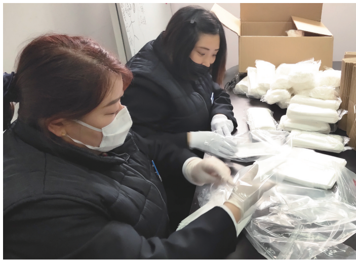
工作人员全程佩戴口罩、手套，严格消毒。

海纳云通过搭建互联互通“IoT+IOC”物联平台，在智慧社区落地智慧安全、智慧服务、智慧出行等物联网智慧场景，从用户无接触出入小区、体温筛查，到外来人口人证比对；从进出社区人员轨迹查询，到用户线上APP交互、智慧垃圾桶……在社区多个环节为疫情防控发挥积极作用，用科