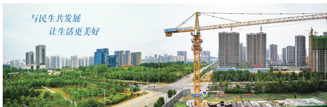
水发建安建设中项目

“黄沙百战穿金甲,不破楼兰终不还”。在未来的征程中,水发建安将乘势而上,以精耕细作深度拓展市场,以项目管控强身健骨,以标化管理凝聚动能,以人才储备凝聚力量,“与民生共美好,与时代同奋进”,水发建安用心铸造未来,致力建造每一个经典,为了“善利万物,建造美好生活”,初心不改,奋斗不止!