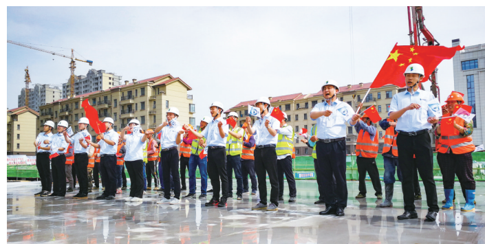
2019年5月水发建安唱响主题为“我爱你,中国”集团大型活动