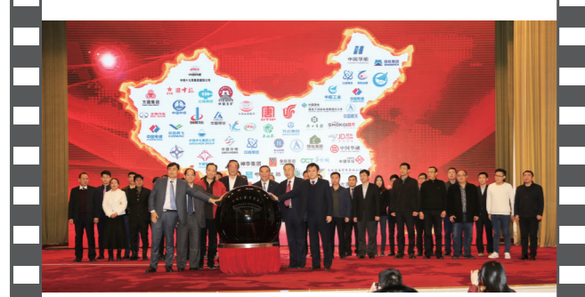
2018年1月20日,北京人民大会堂,在第十五届中国企业发展论坛上,30家企业代表共同启动“十九大精神进企业系列活动”。