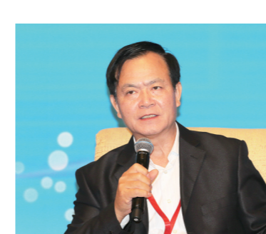
十二届全国政协常委、国务院参事李玉光