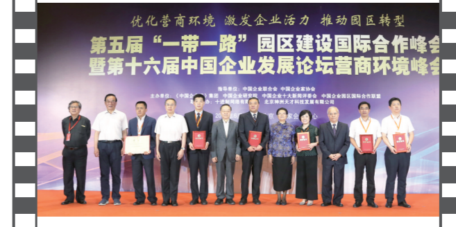
2019年6月29日,北京国家会议中心,在第十六届中国企业发展论坛营商环境峰会上,多位领导为获奖代表颁发证书。