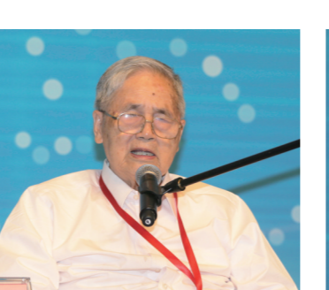
中国工程院院士、著名经济学家李京文