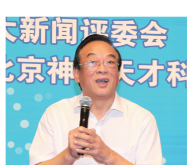
十二届全国政协经济委员会专职副主任,甘肃省原常委、副省长石军

由中国企业联合会、中国企业家协会指导,《中国企业报》集团、中国企业十大新闻评选委员会、中国企业发展论坛组委会主办的中国企业发展论坛,已经连续成功举办了十六届,在我国企业、政府、学术界形成了广泛影响。长期以来,论坛活动得到了国家领导人以及国务院相关部门领导的关注和支持,王光英、许嘉璐、蒋正华、顾秀莲、周铁农、陈昌智、万国权、陈锦华、王忠禹、郝建秀、白立忱、王钦敏等国家领导人都曾出席发布暨论坛活动。中国500强企业和一大批卓有成就的企业家,都曾参与活动。