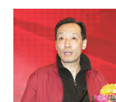
全国政协委员、中华全国新闻工作者协会原党组书记惠生