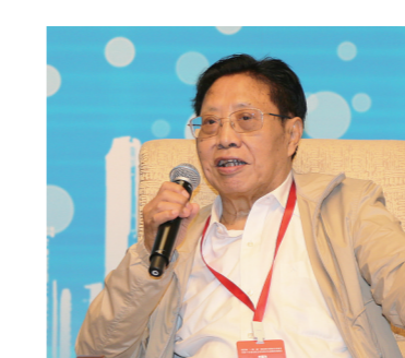
外交部原副部长、外交部政策咨询委员吉定定