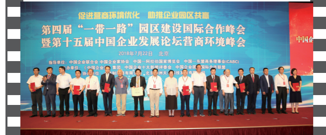
2018年7月22日,北京钓鱼台国宾馆,在第十五届中国企业发展论坛上,参会嘉宾与十佳案例获评单位代表合影。