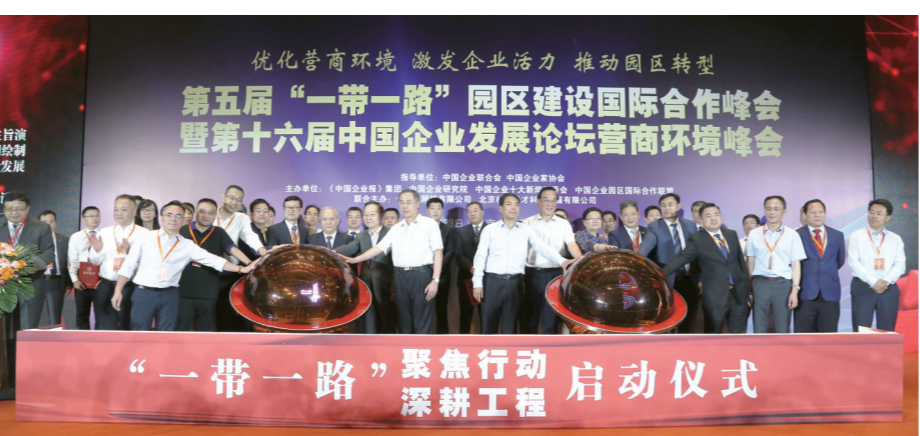
2019年6月29日,北京国家会议中心,在第十六届中国企业发展论坛上,《中国企业报》集团联合相关企业、机构发起了“一带一路”行动工程——合作公司启动仪式和重点项目启动仪式。

为了落实中共中央、国务院《关于营造企业家健康成长环境弘扬优秀企业家精神更好发挥企业家作用的意见》(中发[2017]25号)和国务院办公厅下发的《关于聚焦企业关切进一步推动优化营商环境政策落实的通知》,从2018年5月开始,《中国企业报》集团持续两年时间,分赴全国100个地市、近1000个区县和园区,深入一线采访调研和产业服务,并于2018年发布了第二批“中国企业营商环境(案例)十佳城市”榜单。2019年,《中国企业报》集团再次组织调研小组分头深入地方一线,进行营商环境实地调研,最终形成“2019中国企业营商环境(案例)十佳城市(第三批)”等多个榜单,并于6月29日在北京国家会议中心举办的第十六届中国企业发展论坛营商环境峰会暨第五届“一带一路”园区建设国际合作峰会上对外发布。