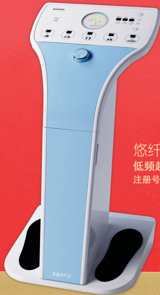
悠纤® 低频超声理疗仪 注册号: 津械注准20172260087