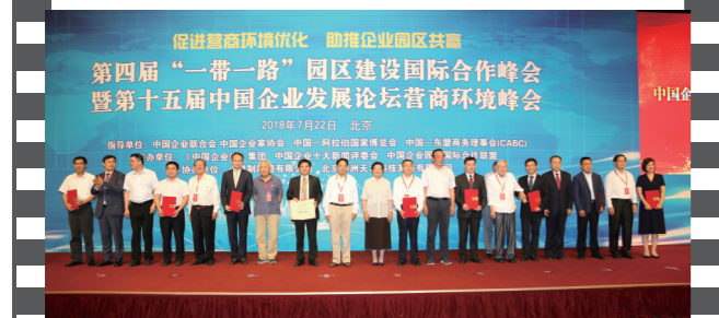
2018年7月22日,北京钓鱼台国宾馆,在第十五届中国企业发展论坛上,参会嘉宾与十佳案例获评单位代表合影。