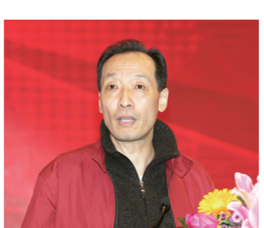
全国政协委员、中华全国新闻工作者协会原党组书记曹慧生