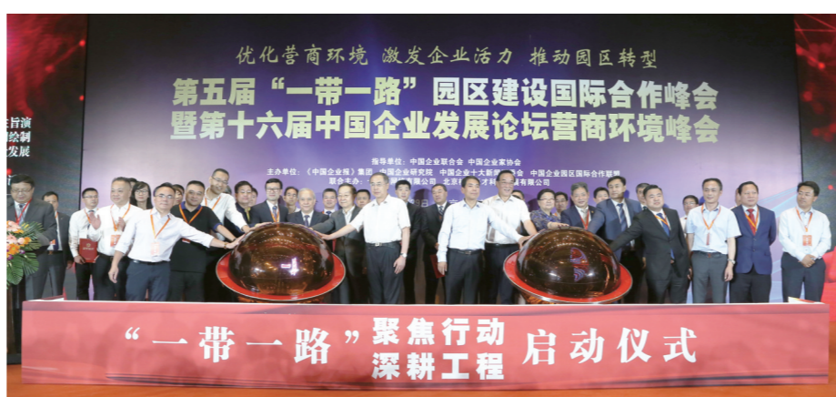
2019年6月29日,北京国家会议中心,在第十六届中国企业发展论坛上,《中国企业报》集团联合相关企业、机构发起了“一带一路”行动工程——合作公司启动仪式和重点项目启动仪式。

为了落实中共中央、国务院《关于营造企业家健康成长环境弘扬优秀企业家精神更好发挥企业家作用的意见》(中发[2017]25号)和国务院办公厅下发的《关于聚焦企业关切进一步推动优化营商环境政策落实的通知》,从2018年5月开始,《中国企业报》集团持续两年时间,分赴全国100个地市、近1000个区县和园区,深入一线采访调研和产业服务,并于2018年发布了第二批“中国企业营商环境(案例)十佳城市”榜单。2019年,《中国企业报》集团再次组织调研小组分头深入地方一线,进行营商环境实地调研,最终形成“2019中国企业营商环境(案例)十佳城市(第三批)”等多个榜单,并于6月29日在北京国家会议中心举办的第十六届中国企业发展论坛营商环境峰会暨第五届“一带一路”园区建设国际合作峰会上对外发布。