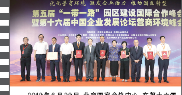
2019年6月29日,北京国家会议中心,在第十六届中国企业发展论坛营商环境峰会上,多位领导为获奖代表颁发证书。