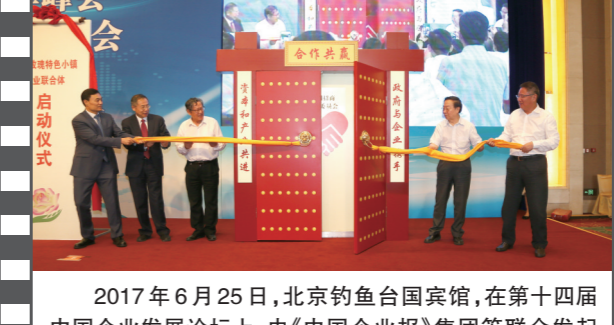
2017年6月25日,北京钓鱼台国宾馆,在第十四届中国企业发展论坛上,由《中国企业报》集团等联合发起的“全国招商联合委员会”宣告成立并举行了揭牌启动仪式。