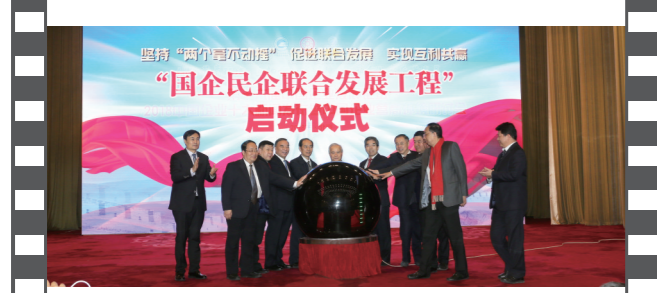
2018年12月28日,北京人民大会堂,在第十六届中国企业发展论坛上,举办了国企民企联合发展工程启动仪式。