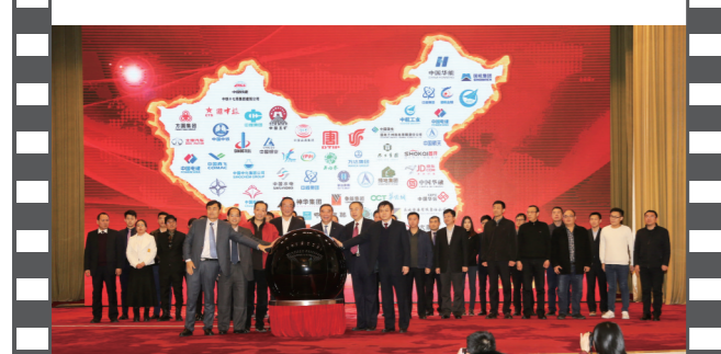
2018年1月20日,北京人民大会堂,在第十五届中国企业发展论坛上,30家企业代表共同启动“十九大精神进企业系列活动”。