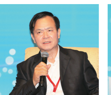
十二届全国政协常委、国务院参事李玉光