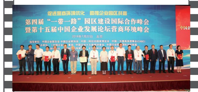
2018年7月22日,北京钓鱼台国宾馆,在第十五届中国企业发展论坛上,参会嘉宾与十佳案例获评单位代表合影。