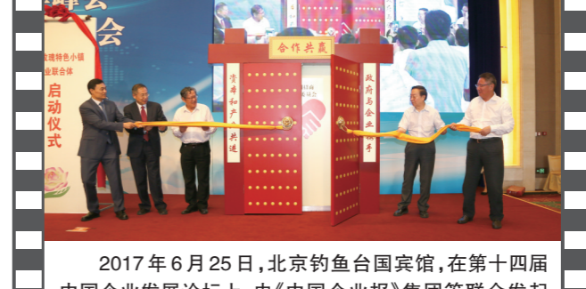
2017年6月25日,北京钓鱼台国宾馆,在第十四届中国企业发展论坛上,由《中国企业报》集团等联合发起的“全国招商联合委员会”宣告成立并举行了揭牌启动仪式。