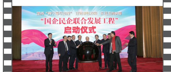
2018年12月28日,北京人民大会堂,在第十六届中国企业发展论坛上,举办了国企民企联合发展工程启动仪式。