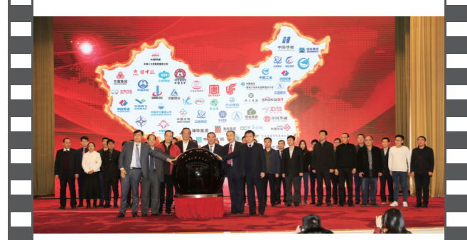
2018年1月20日,北京人民大会堂,在第十五届中国企业发展论坛上,30家企业代表共同启动“十九大精神进企业系列活动”。