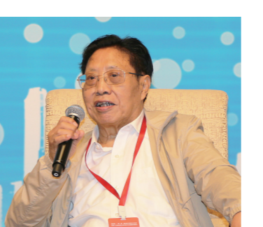
外交部原副部长、外交部政策咨询委员吉定定