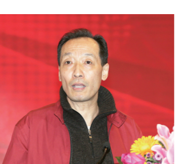
全国政协委员、中华全国新闻工作者协会原党组书记惠生