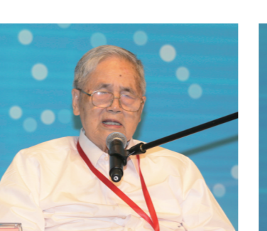
中国工程院院士、著名经济学家李京文