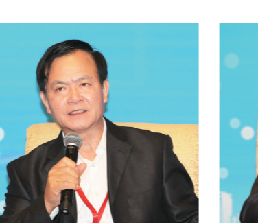
十二届全国政协常委、国务院参事李玉光