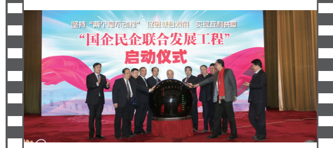
2018年12月28日,北京人民大会堂,在第十六届中国企业发展论坛上,举办了国企民企联合发展工程启动仪式。