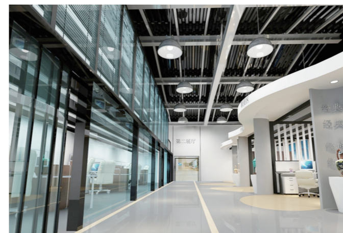
ICID国际交互产业365体验馆办公区、结算中心