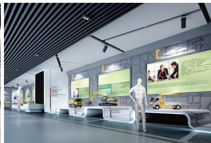
ICID国际交互产业365体验馆人机交互展厅