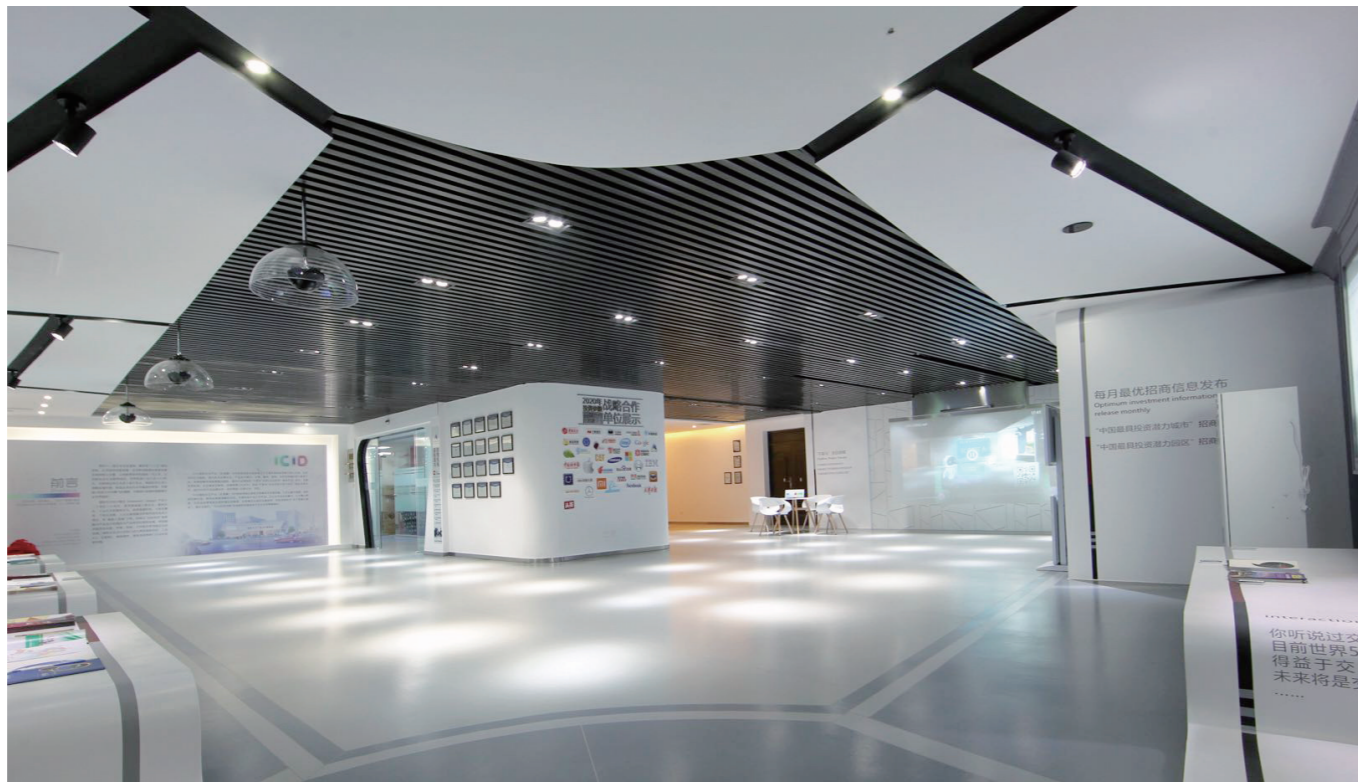
国内首家ICID国际交互产业365体验馆

自2018年正式开馆以来,ICID交互产业365体验馆共接待来自北京、浙江、河北、云南、江苏、江西、黑龙江、山东等地政府、园区、企业、投资机构参观访问、项目洽谈2000余人次。收集、筛选国内外知名企业中最优秀的新技术和新产品1000余项,评选自主研发专利技术含量属国际国内领先的生产型“千里马”项目200余项。投资参股8家企业,为天津市实现招商引资3.6亿元。被称为“永不落幕的展会”的交互产业365体验馆成为展会中的一匹“黑马”,不但引入了国外全方位服务的展览新模式,也在国内首创了将创新科技成果转化为经济增长点的新模式。