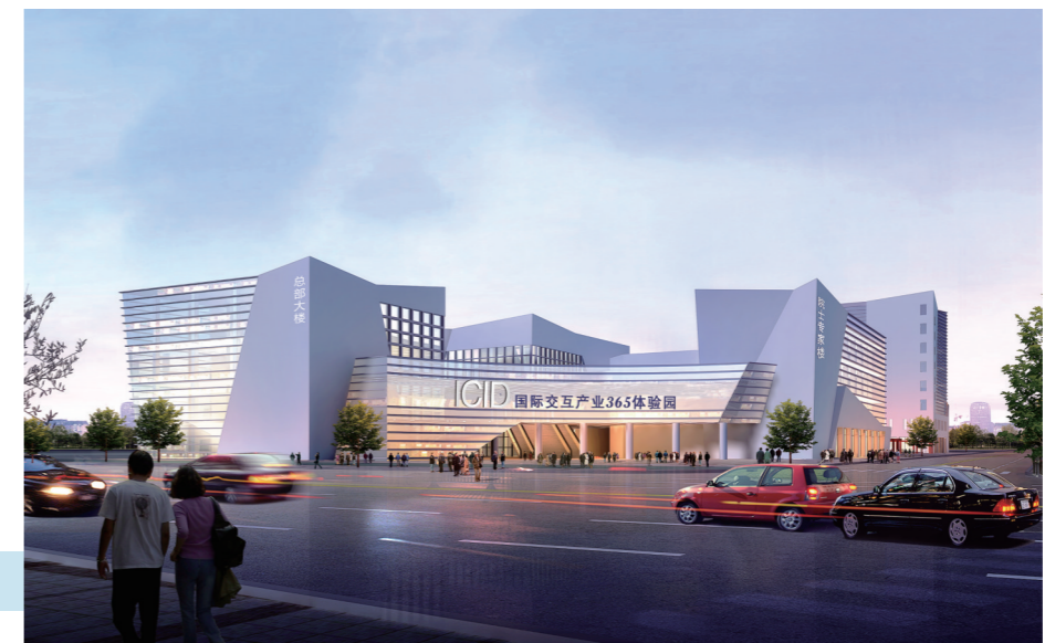
ICID国际交互产业365体验园

在体验馆的基础上,ICID国际交互产业365体验园正在规划中。体验园项目总投资20亿—30亿元,一期为30000平方米ICID国际交互产业365体验园;二期建设国际交互产业总部大楼、“千里马”企业项目落户办公及交易结算中心、中企智库专家楼及部分厂区。技术产品年交易额计划实现30亿元,每年推出一个上市公司,推荐一家行业老大,为一个“千里马”企业拿到全国订单。ICID国际交互产业365体验园助推中国实体经济、传统产业转型升级;为政府搭建创新型的招商引资平台;为“千里马”企业提供技术攻关、资金投入、市场订单等贴身服务;为真正的高端技术、产品做一站式渠道拓展。