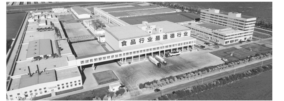
天津食品集团二商迎宾肉类食品有限公司

据了解,食品集团目前拥有科技型企业18户,省级以上技术中心5个,省级重点实验室3个,博士后工作站1个,院士工作站1个,工程技术中心3个,科技从业人员992个,拥有有效专利284项,其中发明专利23项,承担