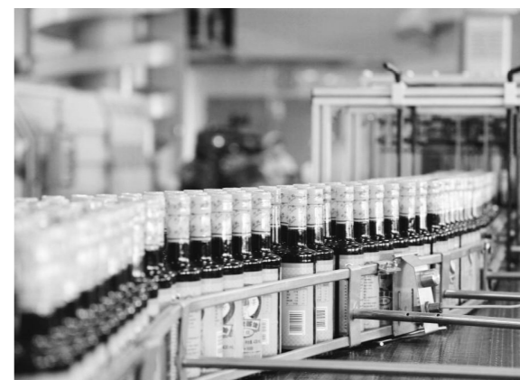
天津食品集团利民调料生产线