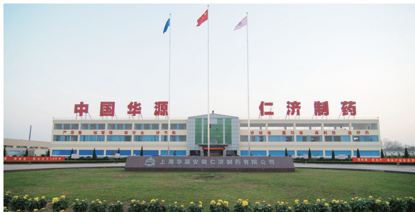
安徽华源医药下属仁济制药厂区

近年来,华源医药实施“工商并举、两轮驱动”战略,依托商业优势,大力发展医药工业,下属上海华源安徽仁济制药、宁夏沙赛制药、安徽锦辉制药、安徽广生药业等四家制药企业拥有大容量注射剂、冻干粉针剂、固体制剂、片剂、颗粒剂、丸剂等200多个品种,近300种规格,产品质量可靠,畅销全国。