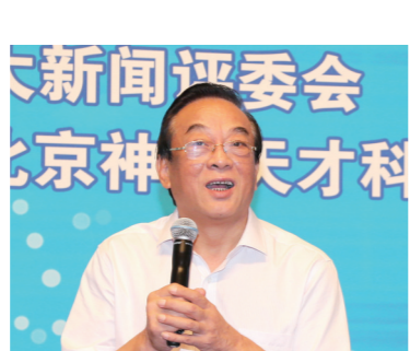
十二届全国政协经济委员会专职 副主任,甘肃省委原常委、副省长石军

由中国企业联合会、中国企业家协会指导,《中国企业报》集团、中国企业十大新闻评选委员会、中国企业发展论坛组织委员会主办的中国企业发展论坛、中国企业十大新闻发布活动,已经连续成功举办了十五届,在我国企业、政府、学术界形成了广泛影响。长期以来,论坛活动得到了国家领导人以及国务院相关部门领导的关注和支持,王光英、许嘉璐、蒋正华、顾秀莲、周铁农、陈昌智、万国权、陈锦华、王忠禹、郝建秀、白立忱等国家领导人都曾出席发布暨论坛活动。中国500强企业及一大批卓有影响的企业家,都曾参与活动。这项活动已成为社会各界岁末年初普遍关注的一个重要话题。