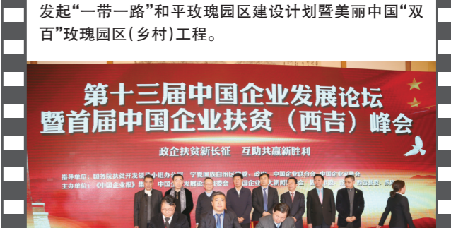
2017年1月15日,第十三届中国企业发展论坛暨首届中国企业扶贫(西吉)峰会举办。