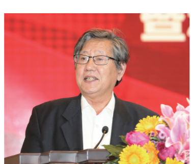
中国企业联合会、中国企业家协会 原执行副会长,《经济日报》原总编辑冯其