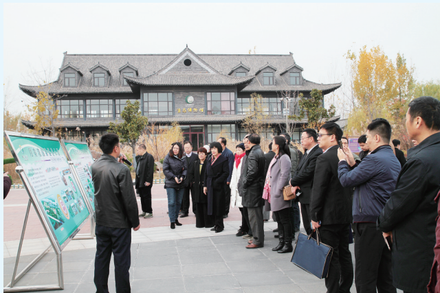
参观月亮湾湿地公园