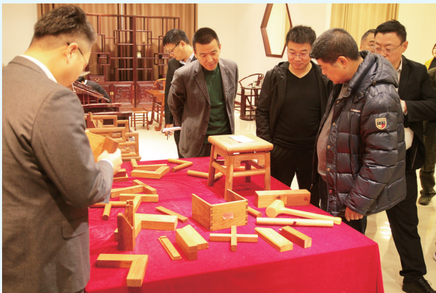
参观泉森红木家具有限公司了解榫卯结构