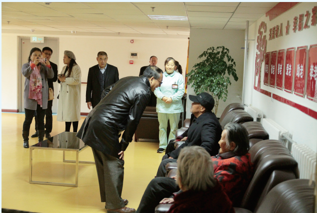
参观银光福源养老中心与入住老人交流