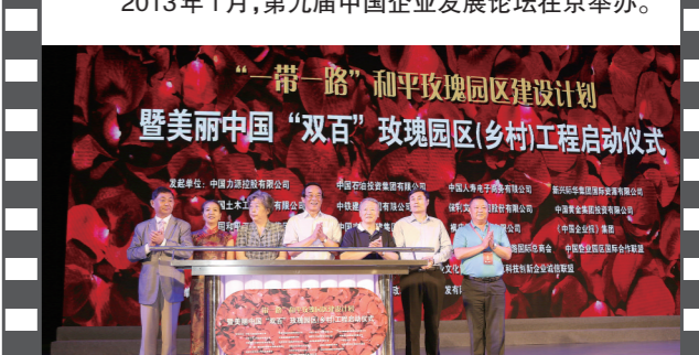
2016年6月26日,在第十三届中国企业发展论坛上,《中国企业报》集团联合19家企业及相关组织,在京共同发起“一带一路”和平玫瑰园区建设计划暨美丽中国“双百”玫瑰园区(乡村)工程。