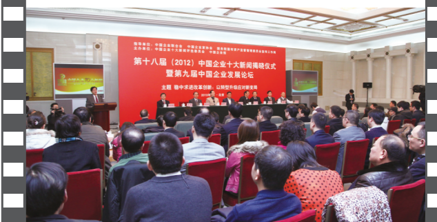
2013年1月,第九届中国企业发展论坛在京举办。