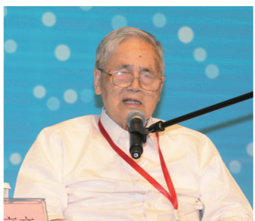
中国工程院院士、著名经济学家李京文

《中国企业报》,中国企业网,中国企业APP,《中国企业报》微信、微博,战新产业微信,特色小镇微信,构建起集内容传播、品牌推广于一体的全媒体服务矩阵。