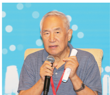
中国工程院院士、著名化学工程专家金涌