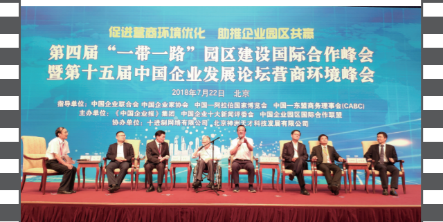
2018年7月22日,第十五届中国企业发展论坛营商环境峰会分论坛现场。