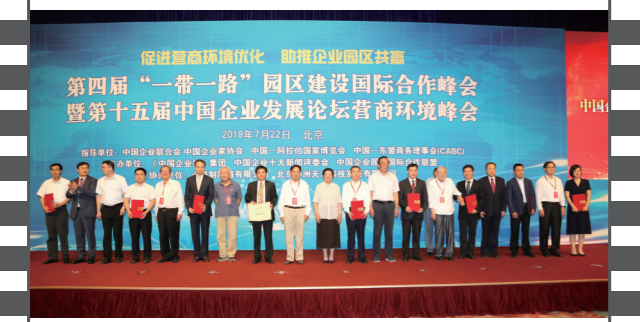
2018年7月22日,在第十五届中国企业发展论坛上,参会嘉宾与十佳案例获评单位代表合影。