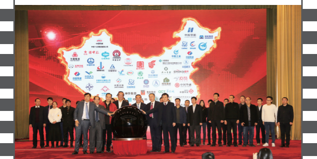
2018年1月20日,在第十五届中国企业发展论坛上,30家企业代表共同启动“十九大精神进企业系列活动”。