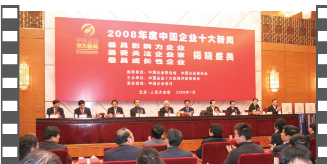
2009年1月,2008年度中国企业十大新闻发布活动在京隆重举办。