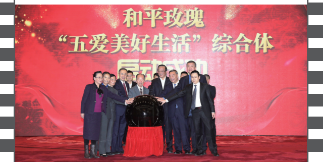
2018年1月20日,在第十五届中国企业发展论坛上,同期举办了和平玫瑰特色小镇“五爱美好生活”综合体暨“中国体育特色小镇产业合作联盟”启动仪式。