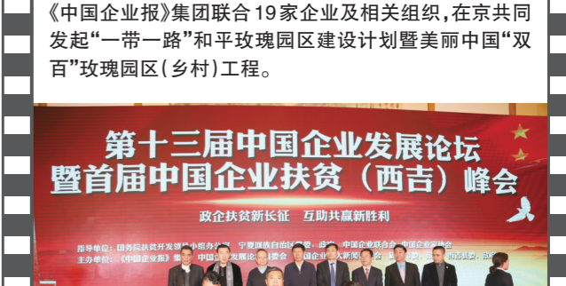
2017年1月15日,第十三届中国企业发展论坛暨首届中国企业扶贫(西吉)峰会举办。