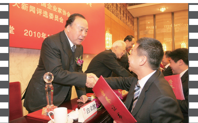
2010年1月,2009年度中国企业十大新闻发布活动在京举办,第九届、第十届、第十一届全国政协副主席白立忱为获奖单位颁奖。