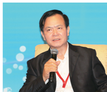
十二届全国政协常委、国务院参事李玉光