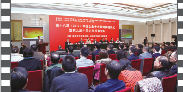
2013年1月,第九届中国企业发展论坛在京举办。