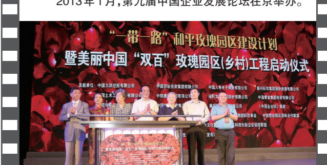
2016年6月26日,在第十三届中国企业发展论坛上,《中国企业报》集团联合19家企业及相关组织,在京共同发起“一带一路”和平玫瑰园区建设计划暨美丽中国“双百”玫瑰园区(乡村)工程。