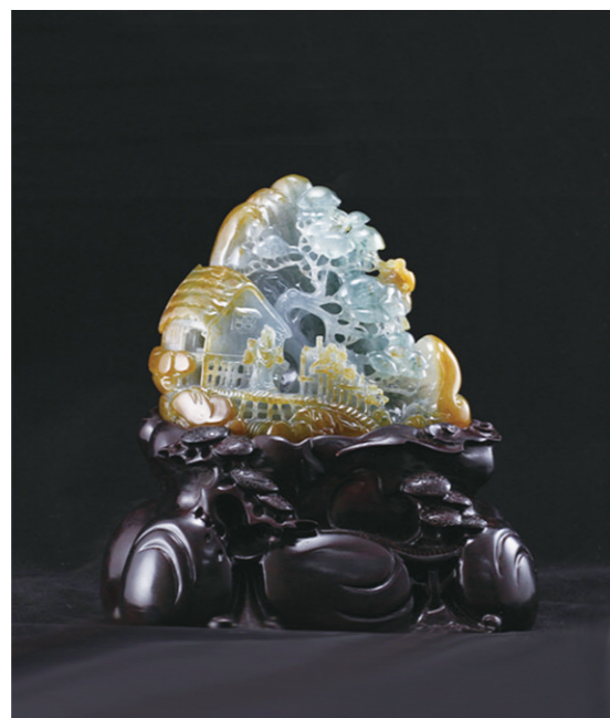
作者:王福林 作品名称:《采菊东篱下》