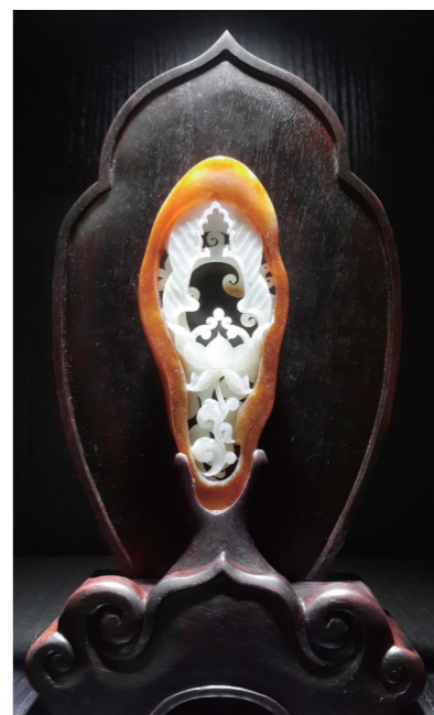
作者:邵军 作品名称:《空蝉》