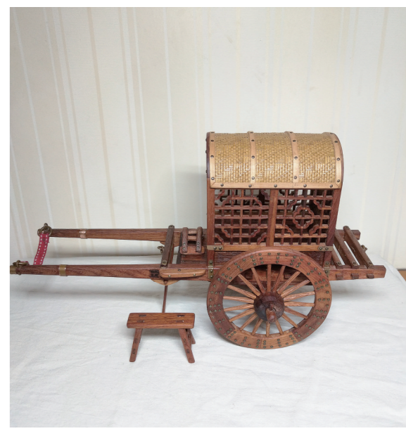
作者:田树豹 作品名称:《明清老轿车》