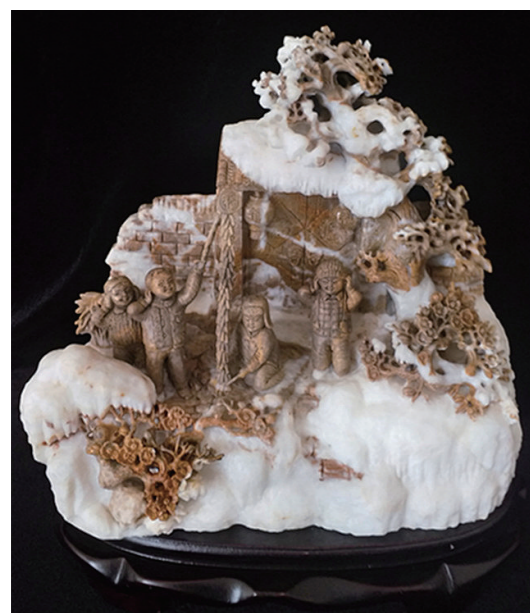
作者:李琪 作品名称:《瑞雪兆丰年》