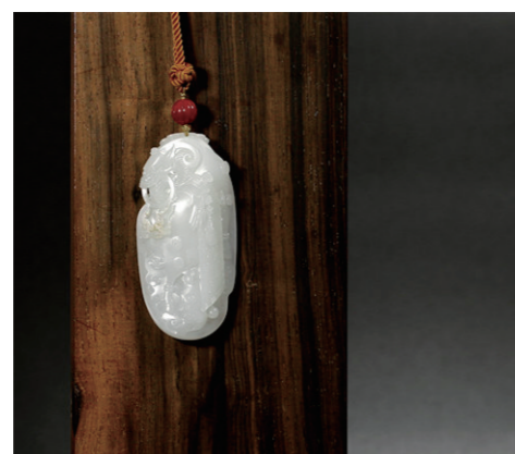
作者:符威 作品名称:《仁义礼乐》