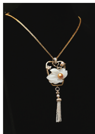
作者:张新程 作品名称:《姿态》