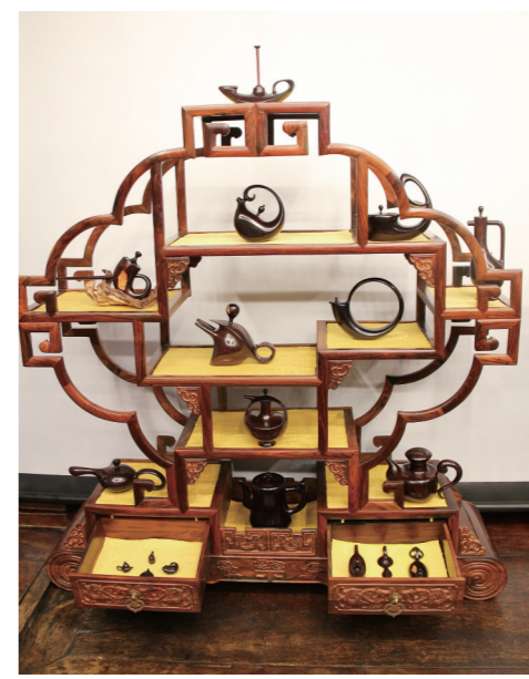
作者:魏宝全 作品名称:《百壶争艳》(紫檀)