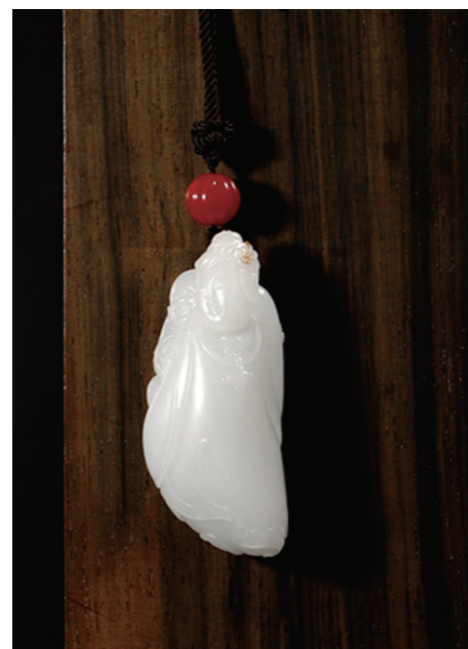
作者:于雷涛 作品名称:《辈辈福》