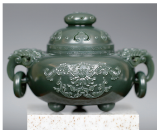
作者:姚发明 作品名称:《香炉》