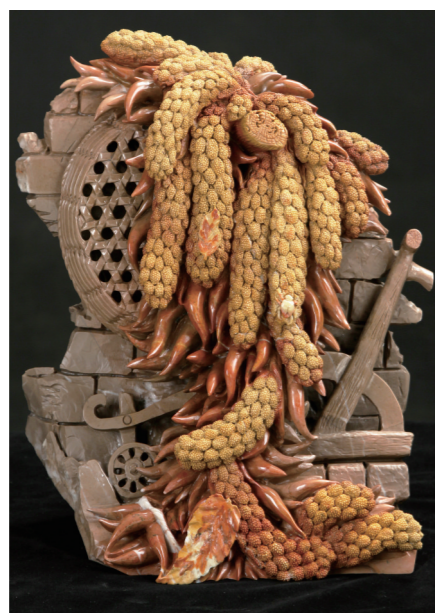
作者:柴业宝 作品名称:《岁序更新》