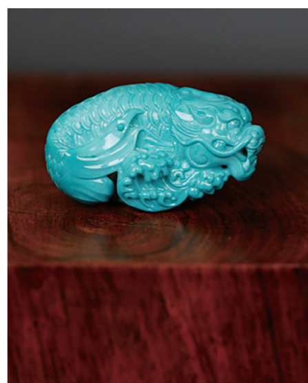
作者:王坤壁 作品名称:《鲨鱼》