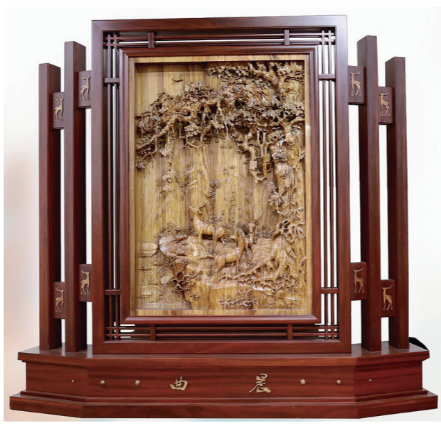
作者:王树元 作品名称:《晨曲》