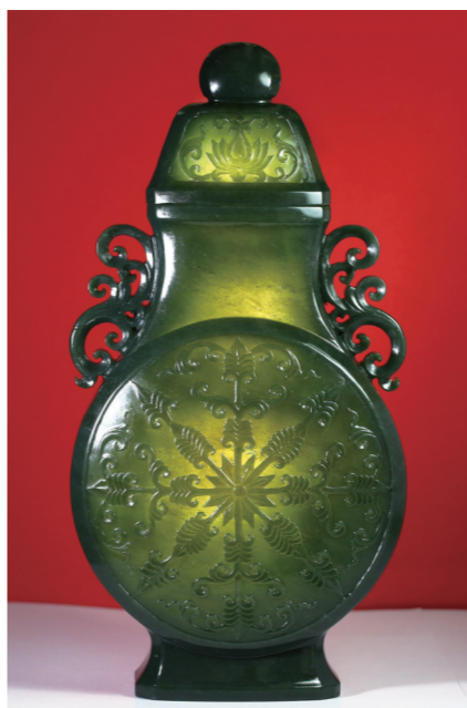
作者:蒋宏利 作品名称:《青玉缠枝纹盖瓶》