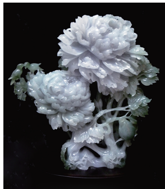
作者:李美现 作品名称:《富贵福喜图》