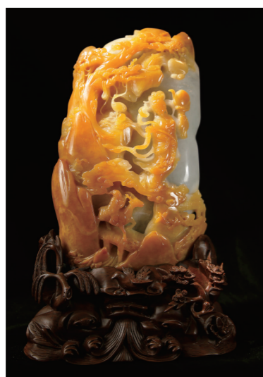
作者:鲍广有 作品名称:《翡翠黄翡飞天摆件》