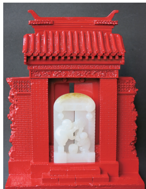
作者:卢志勇 作品名称:《福到》

在“2018首届中国—天津‘弘扬大国工匠精神,继承中华传统文化’国内名家工匠精品主题大展”中,来自天津工艺美术行业协会的二十余位国字号玉雕大师将展出自己的精美作品,参展的玉雕作品大多是近年来创作的工艺精品,其中不乏在国内专业评比中获得金奖的作品,特摘选部分作品刊登。