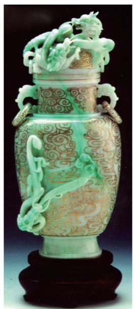
作者:姜柱兰 作品名称:《翠金龙瓶》