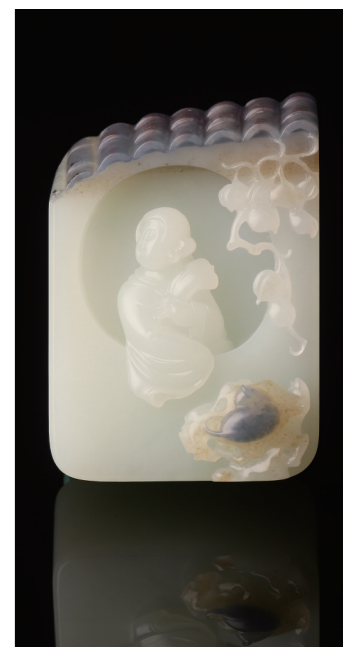
作者:于萍 作品名称:《待月西厢》