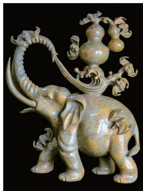
作者:赵盛兴 作品名称:《升官发财》