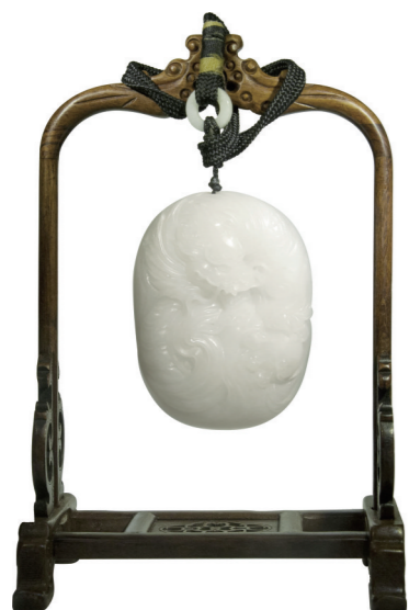
作者:吴裕华 作品名称:《傲龙》