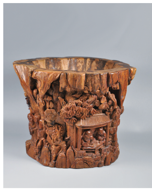
作者:刘吉荣 作品名称:《文会图 笔筒》