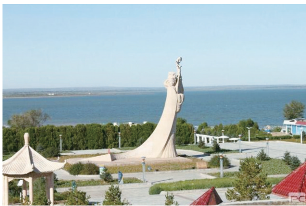
红碱淖——沙漠里最大的淡水湖

位于秦、晋、蒙三省交汇处的神木市,市域面积7635平方公里,总人口54.2万。历史悠久,自古又是塞上重镇,中原汉族和西北少数民族两种文化碰撞、融合,形成了独特的地域特色和风土人情,大漠的苍凉、草原的壮丽、红碱淖的辽阔、杨家城的厚重、高家堡的古朴、二郎山的奇特、天台山黄河沿岸的秀美完美地融合在这里。这是一个交织融合了黄土文化、黄河文化、长城文化、远古文明、农耕