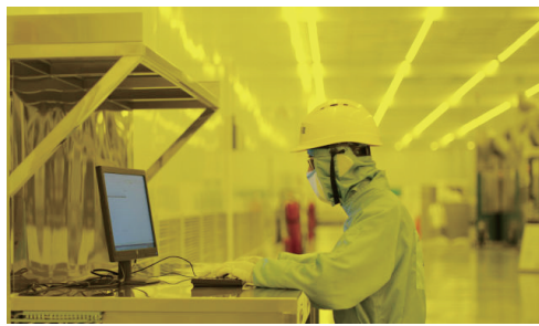
中国电子成都熊猫密封车间