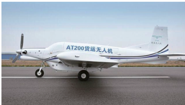
朗星全球首款吨级级货运无人机 AT200