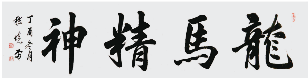
《龙马精神》 134cm x 33cm

一个生命的诞生,孕育着一个灵魂赋予在心,一份挚爱会让他绽放光彩,幼小的心灵燃起了对书法的认知——嵇境雷,出生在一个贫瘠的黄土地上,自然给了他个人兴趣、爱好、品格,让他与书法结下不解之缘;书法给了他坚韧不拔的性格,在充满了艰辛、荆棘和坎坷之路上奋力拼搏,用自己学习的书法途径,求觅自身差距,抱着远大的理想成长;生活给了他对艺术的酷爱,用那模糊的文化概念书写着精神上的锻炼,用内心素养书写在自我优美的字形里。描红临帖,颜柳欧赵,笔走龙蛇,飘逸洒脱。或蚕头燕尾、挺拔如峰,或高如大山、清灵如泉,如云鹤游天,群鸿戏海,严律自己按古人的教诲。一点所失,若美人失一目。一画之失,如壮士失一肱的道理,形成了自己独具一格的书法风格,才情寄于文化的把握之中。文的内容,书的形式,用人品见证安身之本,立命之基。正如曰“书,如也,如其学,如其才,如其志,总之曰如其人而已”。 (邹岩)