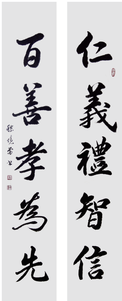
《仁义礼智信·百善孝为先》 138cm x 35cm