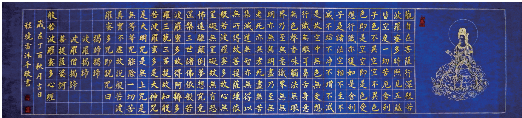
《心经》 138cm x 34cm