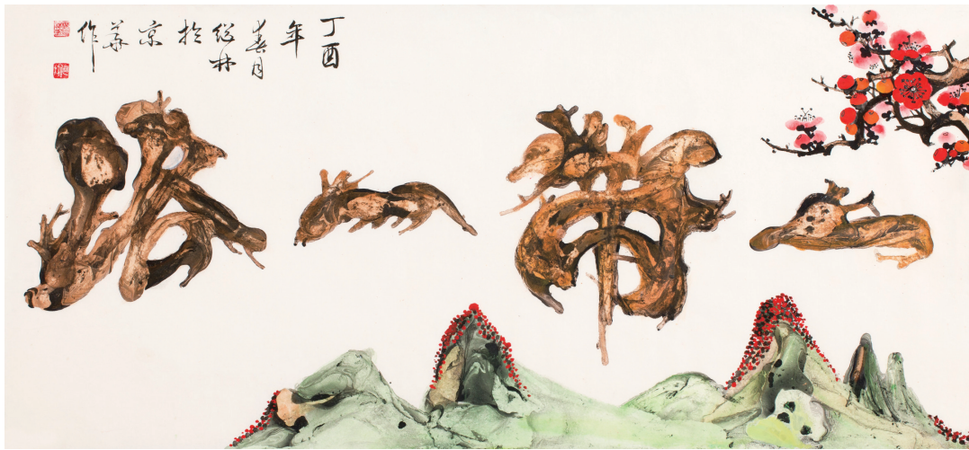
《一带一路》42cm x 90cm