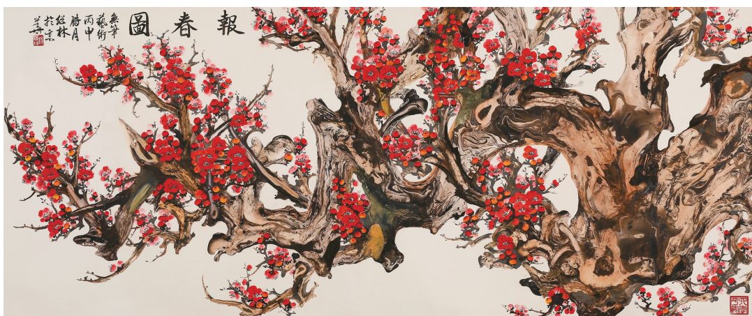
《报春图》198cm x 88cm