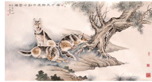
北方天际远古树守图腾(130×69cm)