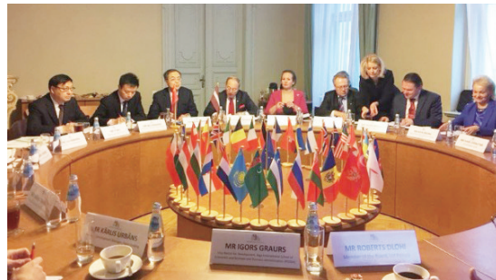
在拉脱维亚期间,代表团一行与拉脱维亚雇主联合会进行了多次会谈,并参加了由其举办的丰富多彩的企业家沙龙活动。