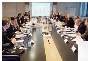
中国企业联合会与挪威工商总会就中挪两个组织间的进一步合作进行了交流商谈。

10日下午,代表团访问挪威石油公司,听取该公司副总裁的介绍并座谈;随后访问挪威电信公司并听取介绍。朱宏任代表中国企业联合会留言题字。