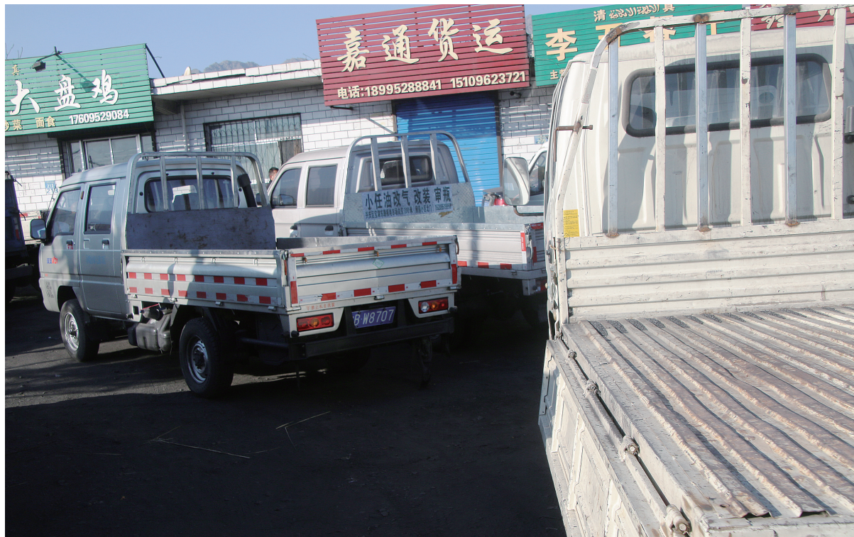
白天的园区里,一辆辆小货车在路边“趴活”,等到晚上替雇主送煤