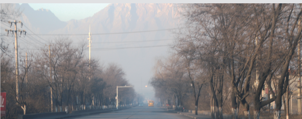
晨雾初起时,路面恢复平静

针对园区环保实际,《中国企业报》记者从平罗县有关部门获悉,环境监管部门提出,要切实提高政治站位,对环保不达标企业,全部实施错峰停产整治;加强园区道路清扫保洁,继续抓好道路机械湿法清扫作业和人工保洁,及时清理道路两侧浮土浮尘,对道路两侧绿化带、裸露地面采取洒水控制扬尘污染;加大错峰停产企业污染治理。 在治理过程中,由石嘴山市、平罗县两级环保部门共同把关,监督停产整治企业,开展露天堆存物料的环境整治,所有物料必须进行全覆盖,错峰停产企业经验收合格,方可恢复生产。企业原料堆场,必须在2018年6月前完成封闭式堆存治理,逾期未完成的,将彻底进行关停。