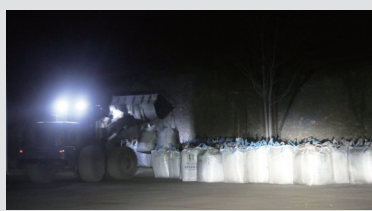
袋装煤被集中到一块空地装到大货车上