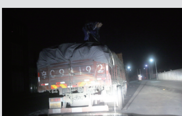
夜幕中,装煤工将煤炭从小车倒腾到大车