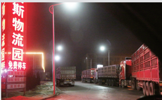
园区旁边的物流园,许多大货车排队等待小车送煤