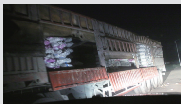
等待送煤的小车到来