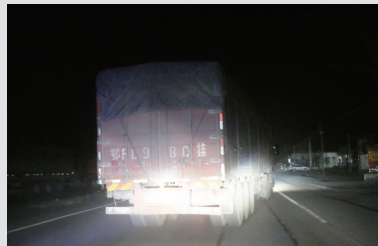
一辆湖北牌照的大货车,装完煤后驶离园区