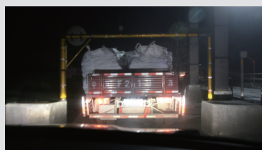
一到晚上,各种小货车拉上煤炭,通过关卡的小车通道,顺利出入园区