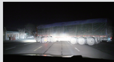
已经装满煤炭的大货车驶出园区