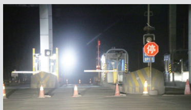
通往园区的关卡,对大货车一律设“停”