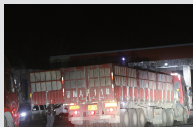
几辆山西牌照的大货车,在园区外的加油站与小货车接驳