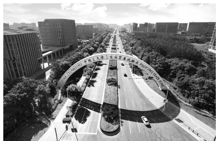
自2015年设立以来,天津自贸区坚持以制度创新为核心,给区内企业带来了众多发展新机遇。

党的十九大提出,创新是引领发展的第一动力,是建设现代化经济体系的战略支撑。当前,全球科