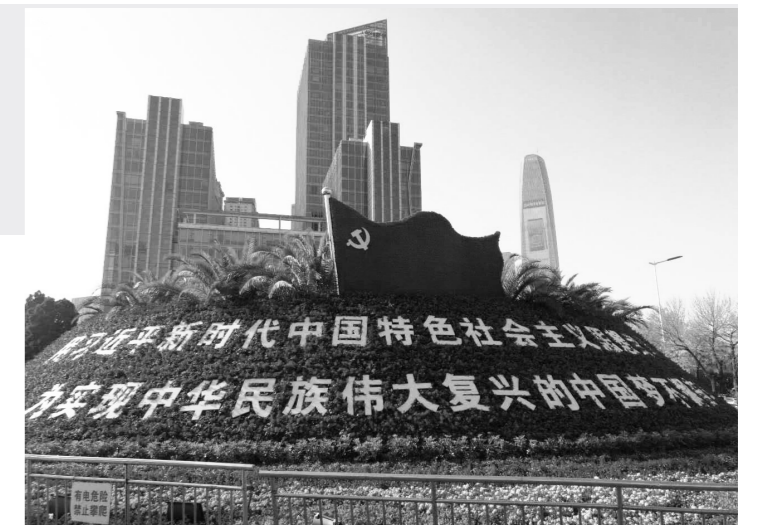
渤海之滨、海河之畔,处处涌动着学习宣传贯彻党的十九大精神的热潮。

时传递给地面佩戴VR眼镜的人,让人“身临其境”。深之蓝是滨海新区智能制造企业之一,代表的正是新区的智能制造企业正在打破技术瓶颈向国际尖端化迈进。而在临港经济区,太重(天津)滨海重型机械有限公司自主研发制造的铝挤压机-235MN已成为当今世界挤压能力最强的超大型挤压机,主要技术集中体现了当代超大型挤压机的发展趋势和先进技术水平。目前,作为全球为数不多的挤压机制造商之一,该公司多项技术填补了国际国内空白,产品在国际上占有一席之地,成为新区重点打造的高端装备制造产业的代表。