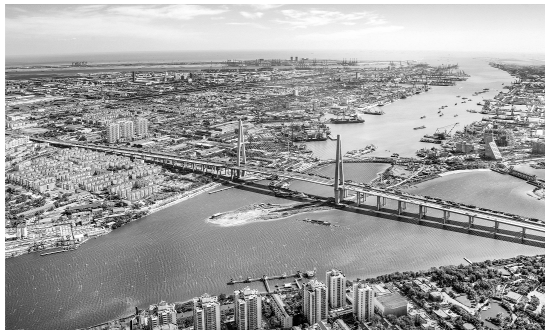
天津港鸟瞰。坐落于天津滨海新区的天津港,背靠国家新设立的雄安新区,是京津冀的海上门户,是中蒙俄经济走廊东部起点、新亚欧大陆桥重要节点、21世纪海上丝绸之路战略支点。

滨海新区正积极打造集聚经济、开放经济、智能经济“三大经济”,大力实施协同发展深化行动、产业聚焦升级行动、深化改革攻坚行动、开放环境创优行动、城市品质提升行动、民生福祉增进行动“六大行动”,强化全面从严治党“一个保证”,全力创建繁荣宜居智慧新城。