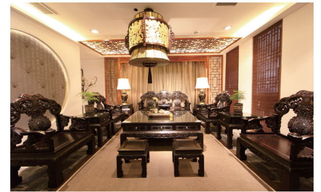
如意沙发组。散发温润古朴的东方神韵。