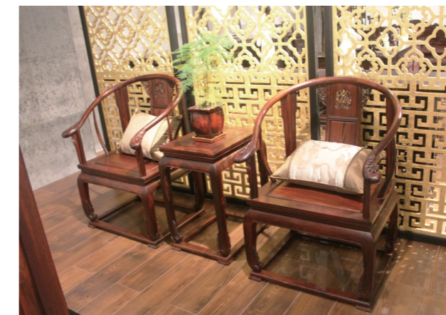
皇宫圈椅-酸枝。我国的红木文化自古就有“睡花梨紫檀、坐酸枝、用鸡翅”的说法。酸枝木家具坐着稳,不硬不凉,对腰椎有一定的保健作用。