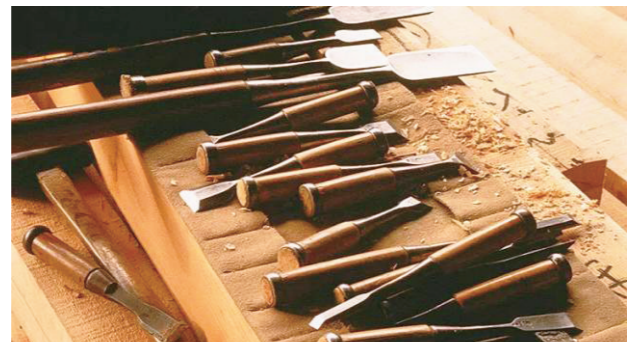
传统木匠做家具时使用的部分工具。