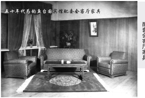
五十年代的钓鱼台国宾馆配套会客厅家具。

“惠福”与“红韵中国”是不同历史时期的称谓,本系同一命脉的传承。天津家具五厂用与时俱进的发展理念,运用以人为本的指导思想,靠品牌占领市场,创造精品。而随着人们生活水平的提高和文化素养的提升,红木家具的价值已经越来越被大众所关注。中华民族文化传承的生命力,通过一件件家具被展现出来。在对这些家具所凝聚的历史美和文化韵味细细品味时,它们所散发的隽永魅力让人深深陶醉。