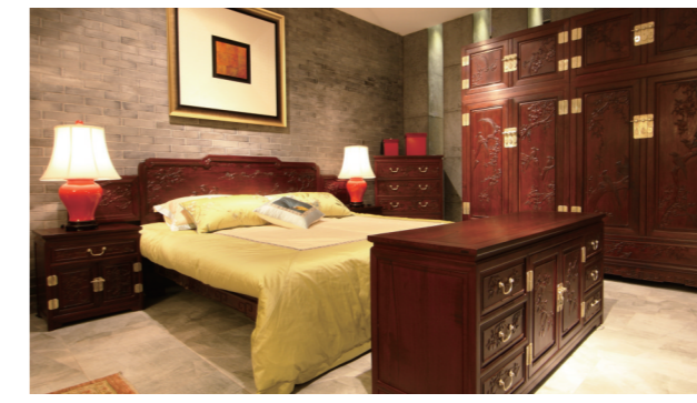
四季平安(花果)卧房。家具五厂的红木家具追求选材上的求真求精,工艺上的至善至美,点线面结合的艺术手法,雕刻元素的寓意深远。

鲜明的时代特征、地方特色和民族风格。如果说传承是对前人文化成果的回顾,创新便是在科技信息化时代中的大胆前行。传承与创新如影随形,标新立异,互促共进。传承与创新是中国家具得以延展和维新的思想根源。而天津家具五厂九十年来生产出的每一件家具,都是以敬畏之心为自然注入生命,以“文心雕龙”的赤子之心为家具引入文脉,以“借古开今”的大无畏精神为传统拓展新篇。