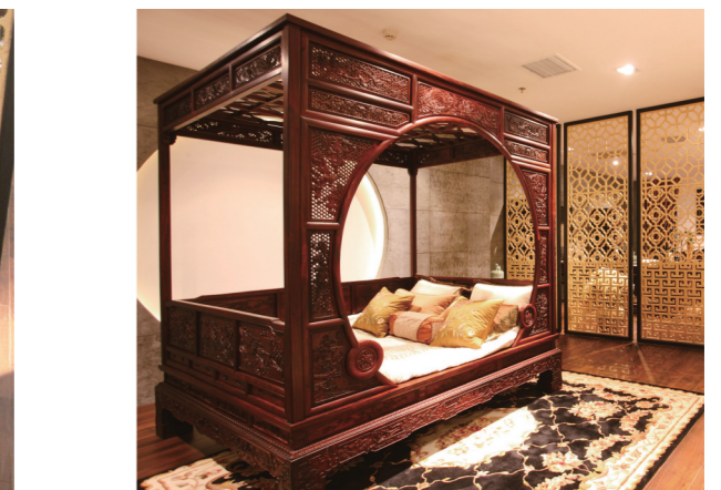
古人常说:红木养心。这是因为红木家具作为中国传统文化与精神的载体,其气韵内敛而平和,与古代“天人合一”的观念和宁静致远的志趣是相契合的。