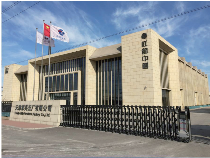
家具五厂经过岁月的洗礼,迎来了九十岁的生日。

老子说,“天下大事,必作于细。”能基业长青的企业,均有着精益求精、追求极致的职业品质。而且,这种对“匠心”的追捧,有“技进乎道”的文化源流,从旧时代的师徒制度,到现代化的工业生产,始终未曾中断过。走过九十年岁月的天津家具五厂,为这种传承做出了诠释。