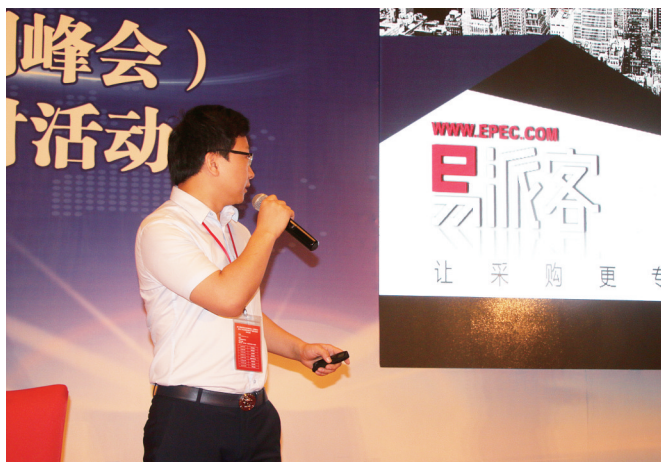
易派客将助力江阴企业更好发展

面向工业品电商蓝海,打算将产业链和供应链价值用到极致的易派客,目标就是依托拥有34年历史的中石化老牌大型能源化工企业,把自己打造成世界一流的工业品电商平台,利用“互联网+供应链”的模式助力全国各企业和政府提升采购效率、降低采购成本,助力国家供给侧结构性改革。