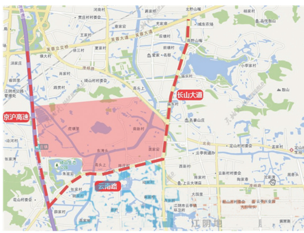
项目选址江阴市云亭镇,京沪高速以东,长山大道、澄杨路以西,云南路以北,绮山湖及周边区域,主要涉及云亭村、花山村、定山村三个村。