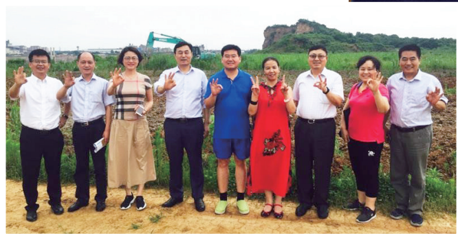
中国企联于武副理事长一行,实地考察了江阴和平玫瑰特色小镇建设项目后,对项目未来非常看好。大家在项目现场合影时,以同一手势,寓意着项目在推进,三年大变样。