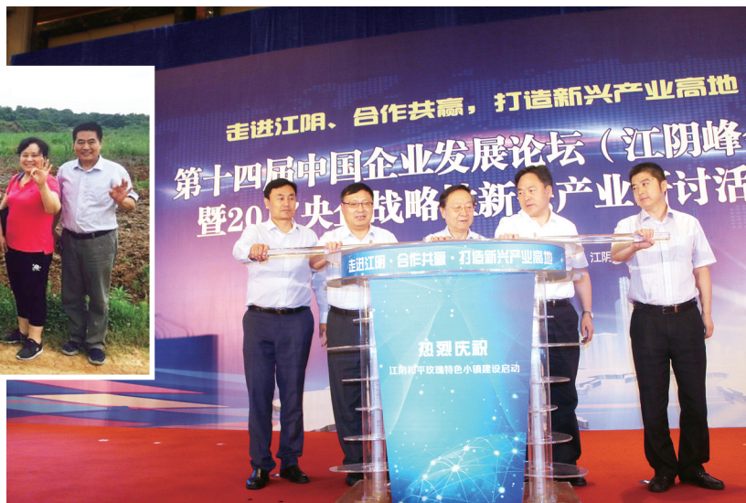
江阴和平玫瑰特色小镇启动