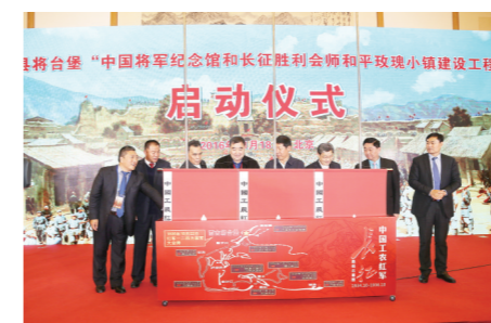
西吉县将台堡“中国将军纪念馆和长征胜利会师和平玫瑰小镇建设工程”启动仪式