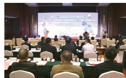
第十三届中国企业发展论坛 2015 中国企业十大新闻揭晓仪式