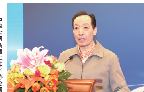
中华全国新闻工作者协会原党组书记 罗惠生