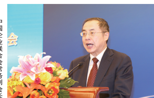
中国企业联合会常务副会长 兼理事长 朱宏任