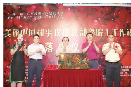
“一带一路”和平玫瑰园区建设计划暨美丽中国“双百”玫瑰园区(乡村)工程启动仪式