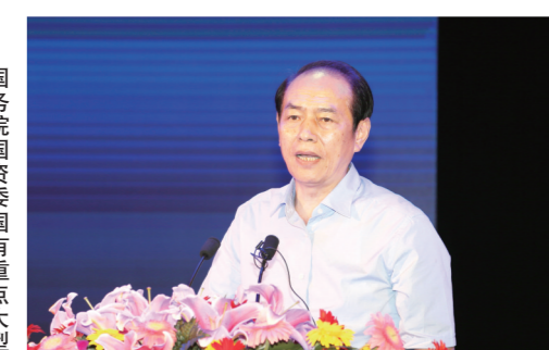
国务院国资委重点大型企业监事会原主席 季晓南