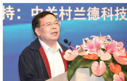
解放军原副总参谋长 张黎上将