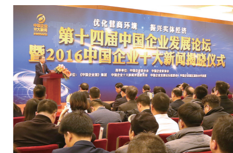
第十四届中国企业发展论坛暨 2016 中国企业十大新闻揭晓仪式