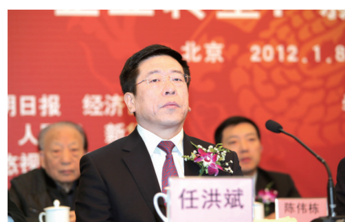
中国机械工业集团有限公司董事长 任洪斌