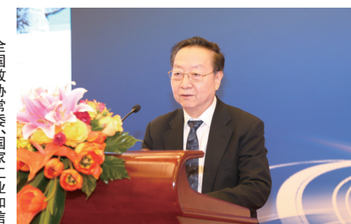
全国政协常委、工业和信息化部副部长 李黔中