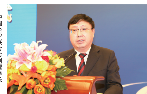
中国企业联合会副理事长 于武