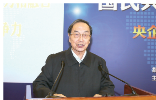
第九届全国人大常委会副委员长 中国城镇化促进会主席 蒋正华

多年来,《中国企业报》集团与中央部委及各级地方政府建立了高效互动关系,与数十万家企联会员单位保持了密切合作关系;与数百家国家级、省级、市(县)级产业园区建立并保持战略合作关系;与数十家产业(行业)协会建立了资源合作关系;与数十家驻华使馆、驻华商会等建立了友好合作关系。