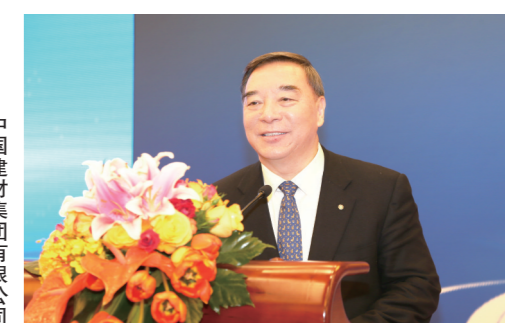
中国建材集团有限公司董事长 宋志平