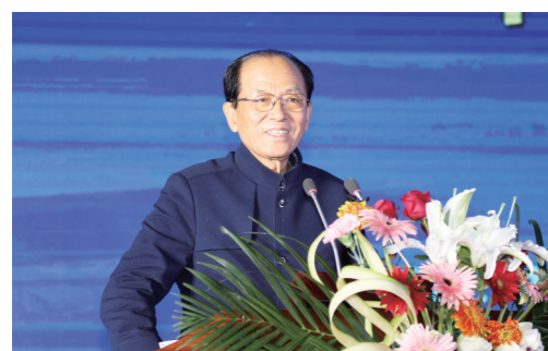
解放军总后勤部原政委 张文台上将