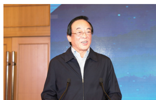
全国政协经济委员会副主任 石军