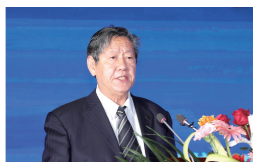
中国企业联合会原执行副会长 冯井