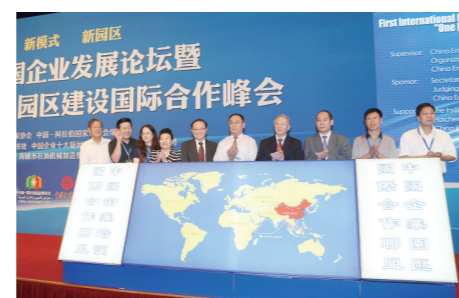
第十二届中国企业发展论坛暨首届“一带一路”园区建设国际合作峰会