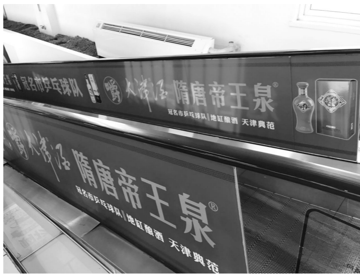
5月6日,河西区大润发超市黑牛城道店内,“大津酒”在扶梯两侧打出的广告字样。

多家超市、烟酒店则发现,虽然案件全部终结,但构成对津酒集团“津酒”注册商标专用权侵害的“大津酒”仍然在市场流通销售,消费