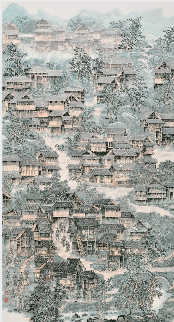
《瑶乡小寨》系列之一