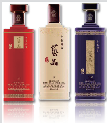
中艺财富酒是与贵州赖贵山酒业有限责任公司联合出品的文化酒。它凭借中艺财富深厚的文化积淀,将中国传统酒文化与书画文化结合。