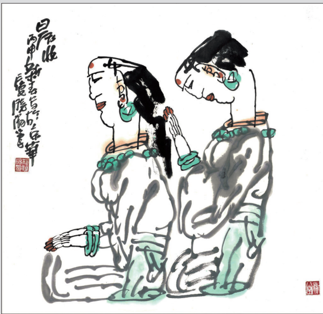
中国国家画院院长、中国美术家协会副主席杨晓阳作品:《晨妆》