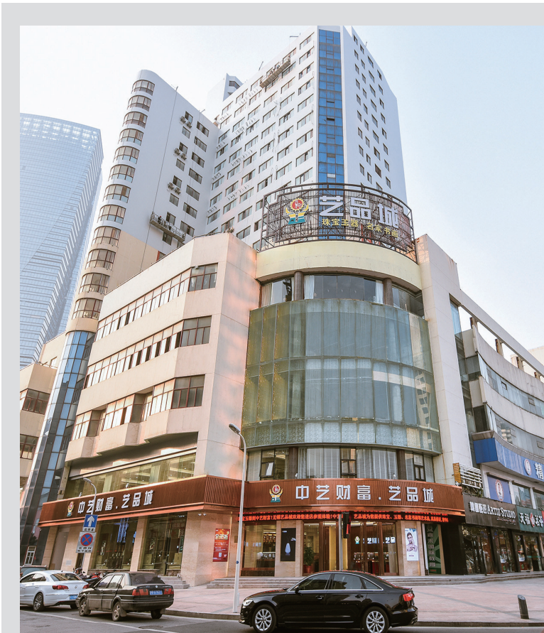
中艺财富设立的艺术品商城。目前,已在北京、上海、常州、无锡等多个省市设立6家直营店。未来中艺财富将加快布局,实现艺术品商城在全国的扩张。

中艺财富文化酒是由中艺财富(北京)酒文化有限公司与贵州赖贵山酒业有限责任公司联合出品的文化酒。它凭借中艺财富深厚的文化积淀,将中国传统酒文化与书画文化结合,旨在通过中艺财富文化酒的传播,起到铸就高品位生活,传递社会正能量,弘扬中国书画艺术等多种作用。