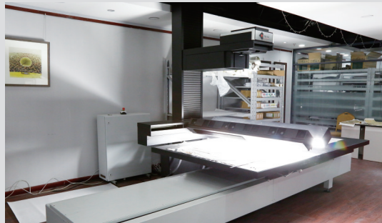
中艺财富名家版画作者均为中艺财富画院签约的当代中国美术名家。每一幅版画均印制有中艺财富画院的印章及限量编号,使画作的真实性获得保障,也让艺术品市场得以规范化发展。