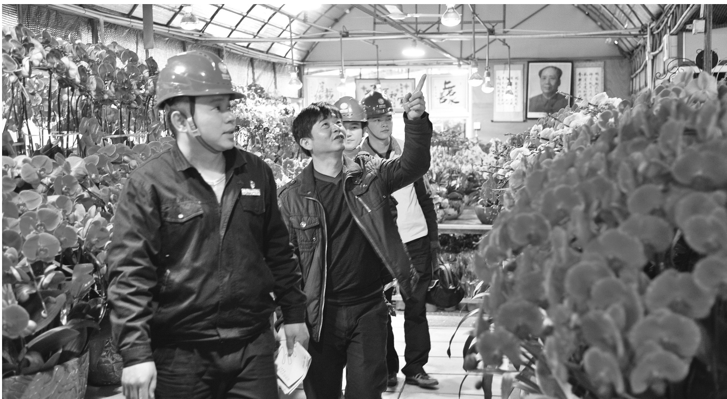
国网南安市供电公司党员服务队节前走访花农

近年来,国网南安市供电公司围绕福建省南安市委、市政府工作重心,以服务大局、服务全局为使命,夯基强网、争先进位,主动对接政府重点项目建设,提前摸清拟筹建各类园区、大型城市综合体供用电情况,常态化深入辖区企业走访,主动担当企业“电参谋”,为用电客户“量身定制”供用电方案,不断提升服务能力、强化服务作风、拓展服务内涵,打通联系南安市64.35万用电户“最后一公里”,做实服务全市153万群众“最后一百米”,为建设机制活、产业优、百姓富、生态美的现代化新南安提供可靠用电保障。