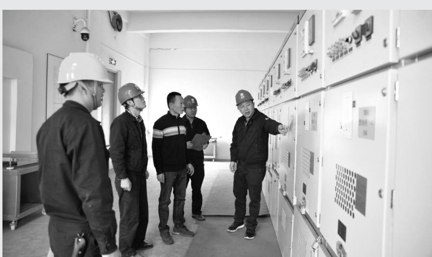
国网南安市供电公司党员服务队义务为泉州市聪勤机械制造有限公司自建110千伏变电站进行“会诊”。