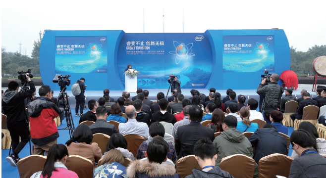
英特尔成都投产仪式现场

科技型企业是自主创新的主体,是促进经济发展的重要力量。2016年,成都高新区新增各类科技型企业5200家,同比增长72.75%,占成都市新增科技企业总量的43%。其中,高层次人才创业企业419家,大学生企业和团队130家;新增销售收入突破1000万元企业71家、上规入库企业208家;新认定高新技术企业150余家,累计达830家;新增高层次创业人才1223名,其中海归博士255人。截至2016年底,成都高新区的科技型在孵企业总量达12700家,各类型企业存量达83371户(不含省、市工商局登记数),在全国国家级高新区中位居前列。