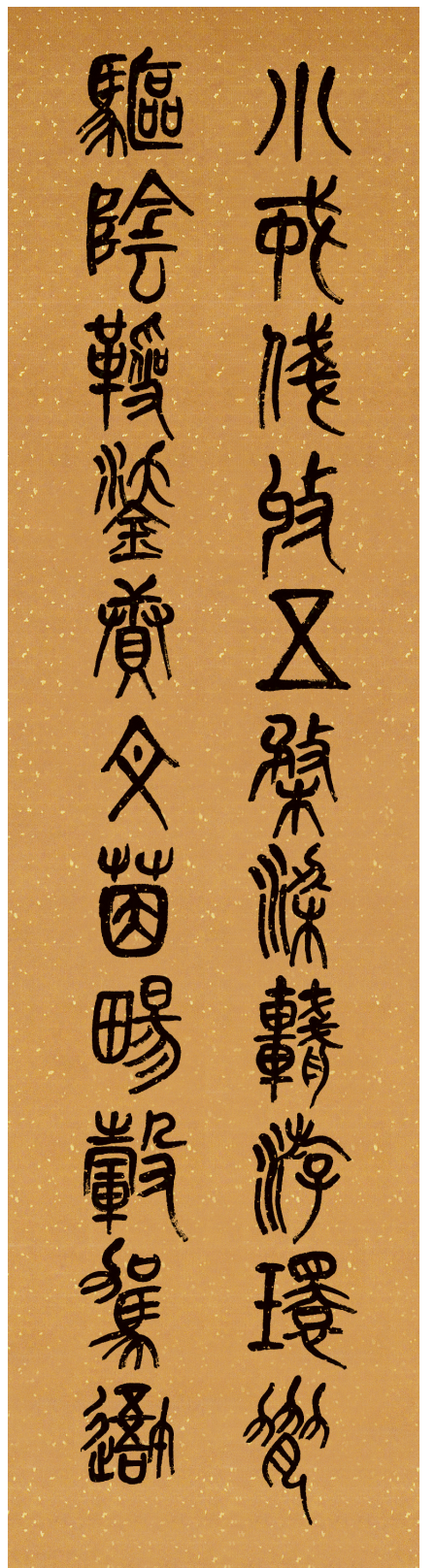
小戒錢收五樂梁納游环齋 駟阴剛靈慶文茵暢駟駕我