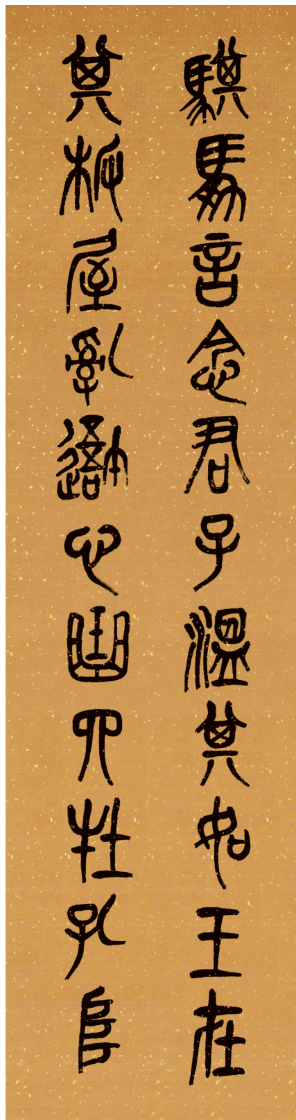
騏驎言念君子温其如王在 其板區乱我心曲四牡孔阜