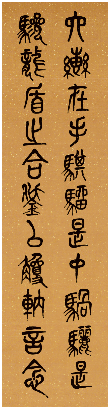
六轡在手騏驎是中駟驪是 驪龍盾止合鑿以轡轡言念